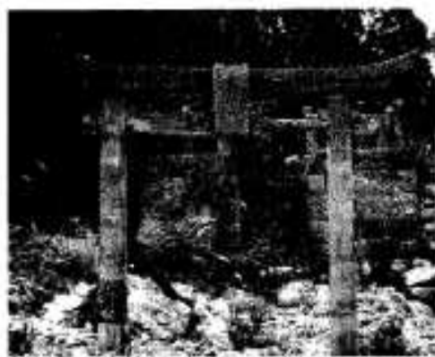
最初の恵比須神社(戸柱下)

※阿久根の自然や昔の様子が偲ばれる語がありましたら記録して残したいものです。お知らせください。