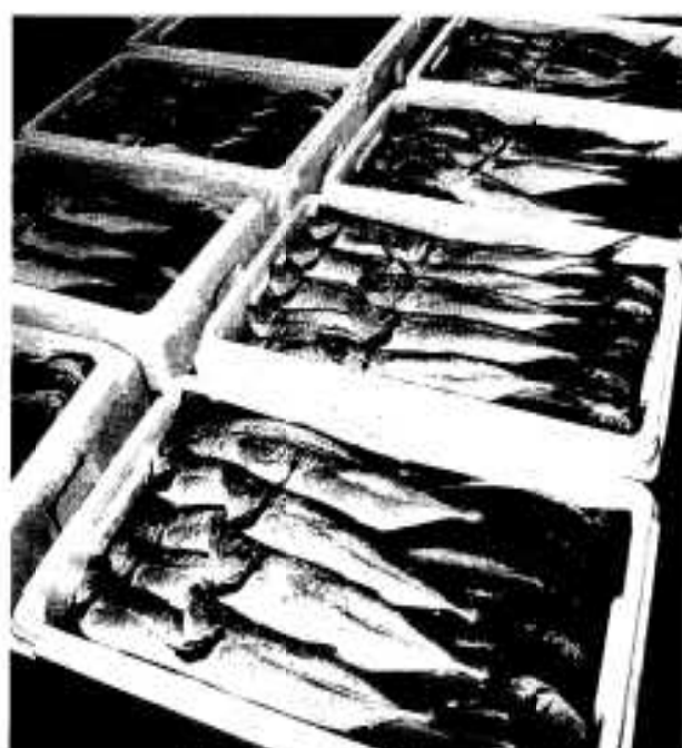
箱づめされた「華アジ」

市ではブランド化に向けて全国に普及させるにはどこにもない名称をつけようと、キャッチフレーズを募集したところ県内外から四百件の応募があり、商品名選考委員会で厳正な審査の