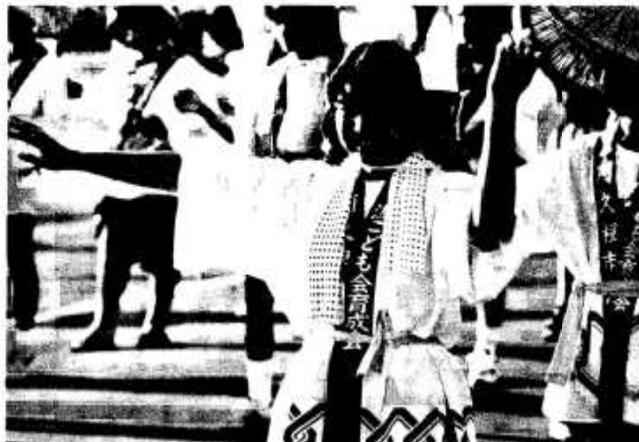
最優秀賞「楽しいみどこい祭り」

みどこい祭り期間中のイベントや風景をテーマにした写真コンテストの審査が行われ、各賞が決定しました。