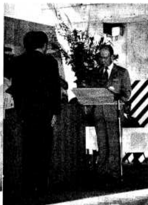
知事より「55選」認定証を交付