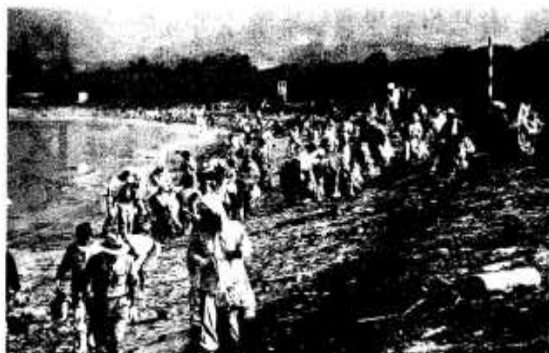
作業中の様子(上) と作業が終わり きれいになった海岸(左)