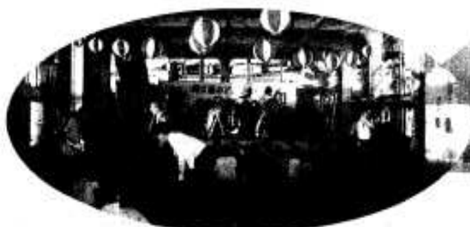
たいへん賑わった「納涼船」