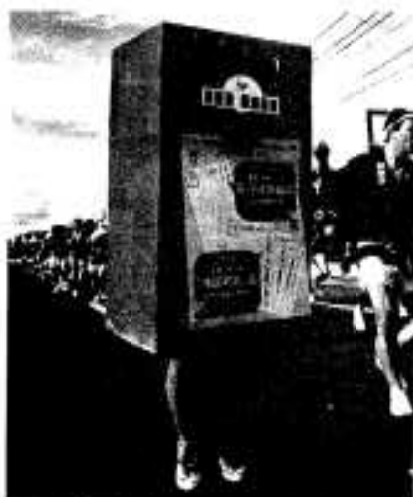
ポストまで踊りだした?