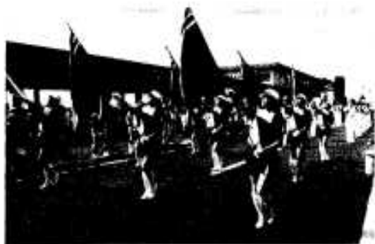
ハンヤ踊りに花を添えた 県警カラーガード隊