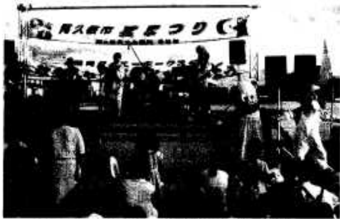
子どもたちに大人気「ぬいぐるみバンド」