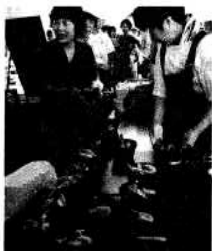
「おいしそー！」 磯大鍋に長蛇の列