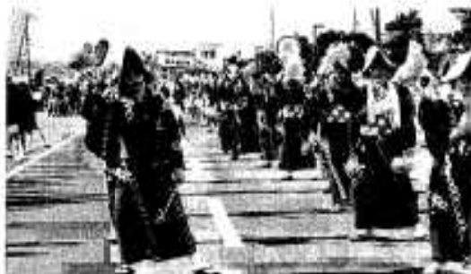
「私たち一糸乱れぬでしょう」