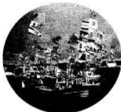
華やかな漁船パレード