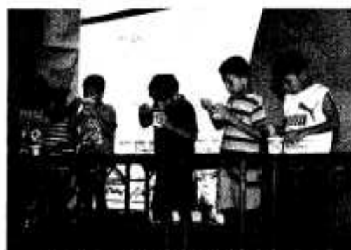
「おいしいけど…頭が痛い」 カキ氷早食い大会