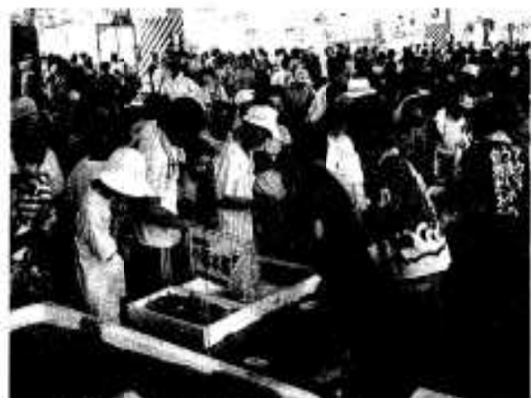
今年もたくさんの人出「おさかな祭り」