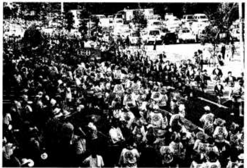
約3,000人が参加したハンヤ踊りパレード