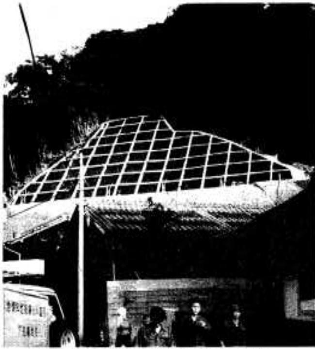
亀裂や斜面の移動が確認された現場

その後、斜面の変化が見られないことから八月十一日に勧告を解除しました。住民の方々の避難は十一日にも及びましたが、その後八月二十四日に激しい雨のため再び避難勧告を出し、翌二十五日に解除するな