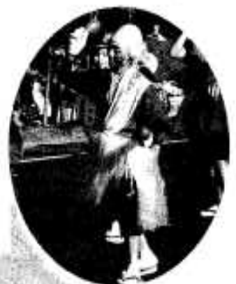
「キバツテ!キバツテ!」