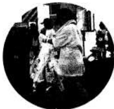
「こ存してしたか？」 「ゴミハスターズ」の活躍