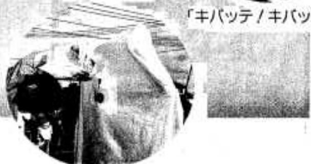
オバケもノドが渇くの?