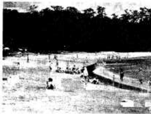
阿久根の景勝地阿久根大島