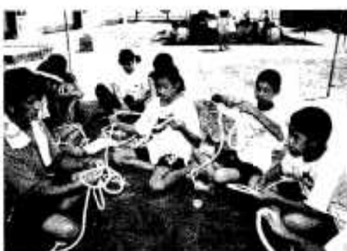
ロープワークを学ぶ受講生

この水産教室は本年度四回に分けて行われ、漁船の体験試乗や水産関連施設への視察などが行われます。