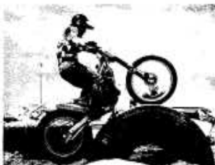
「どんなものでもへっちやら」 バイクトライアル