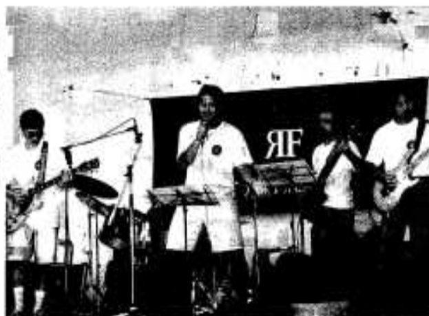
あくねの夏を熱唱 「ローズ・ファクトリー」