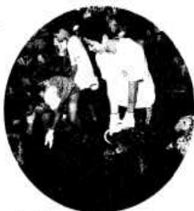
なかなかつかめない 「うなぎつかみどり」