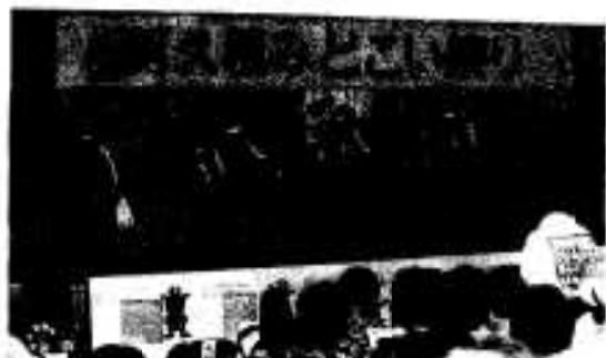
子どもたちも参加「郷土芸能ショー」