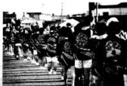
おそろいのハッピーで頑張るぞ