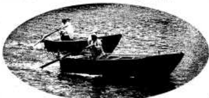
どちらが速いか「伝馬船競争」

「みどこい祭り」の後半は、八月七日から十六日まで行われ、メインのハンヤ踊りパレードやステージショー、花火大会などで賑わいました。 今月は先月号に引き続き、祭りの各イベントを写真で紹介いたします。 また、来年のお祭りでお会いしましょう。