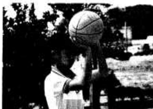
「入ってくれよ」フリースロー大会