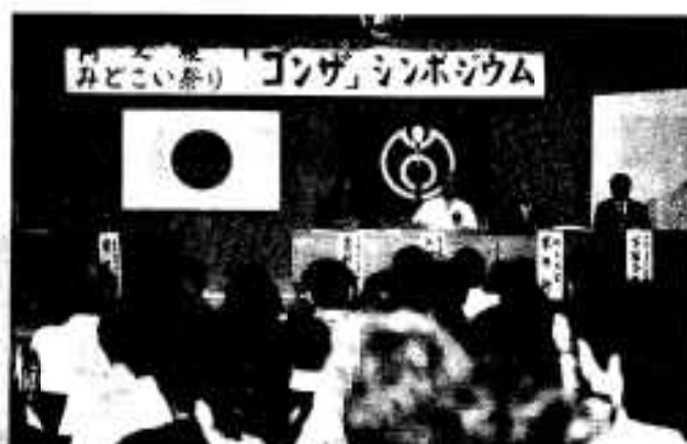
多くの観衆が詰めかけた ゴンザシンポジウム