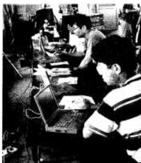
「これはおもしろくて簡単だ」 インターネット体験