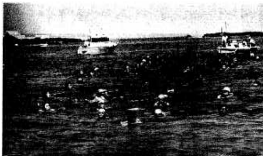
自分の力を信じて泳ぐ「海の子カーニバル」