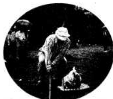
「ここかな？」健康づくりフェスタ