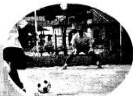
「今度は止めるぞ」 PK大会