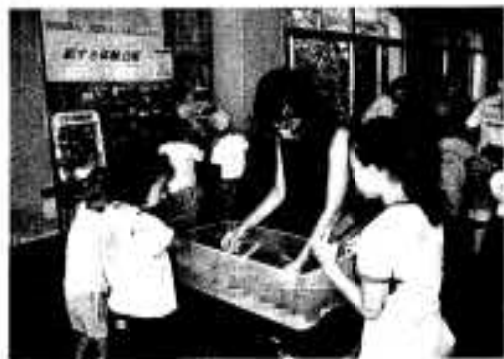
やってみよう ケナフの紙すき