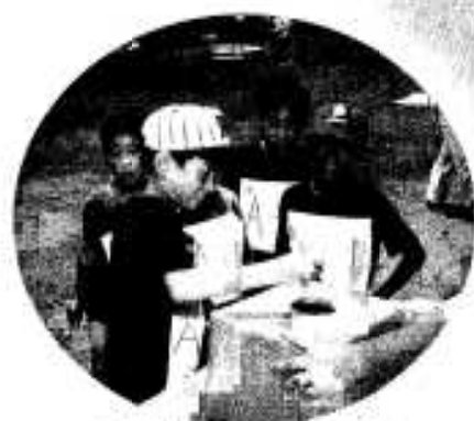
これが最後のクイズだ