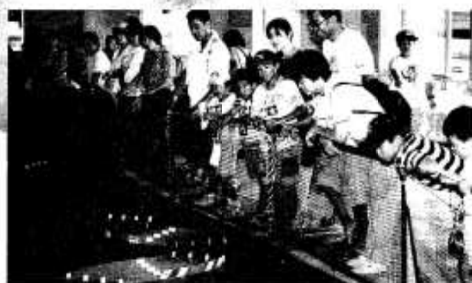
「この車は早いなー」ミニ四駆大会