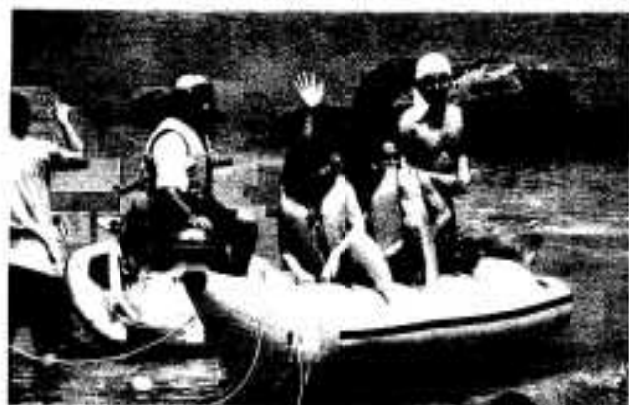
「おもしろーい！」バナナボート