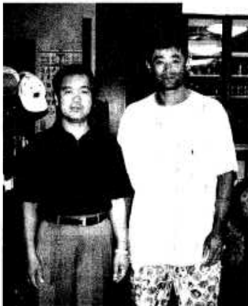
石毛二軍監督と 岩崎ファンクラブ会長