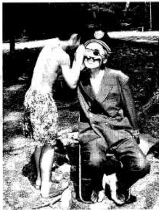
答は「〇〇だよな。キャプテンクックさん？」