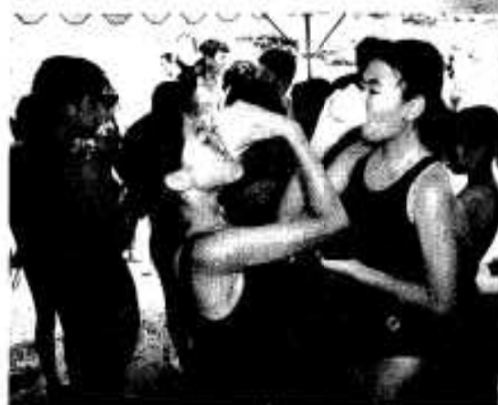
「泳いだあとはゼンザイに限るよ」