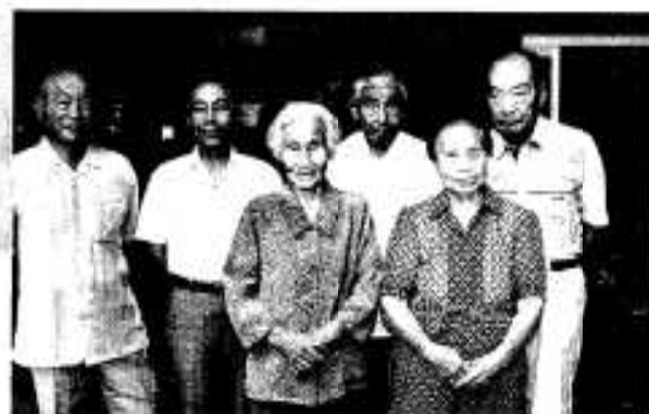
ハママル コマル 「8020」運動で健康な歯を表彰された方々