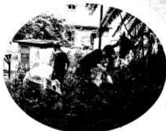
祭りもまずは清掃から