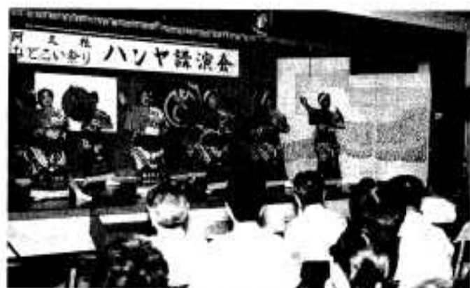
「ハンヤ節」のルーツは？ ハンヤ講演会