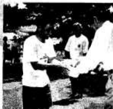
みごと賞品いただきまーす