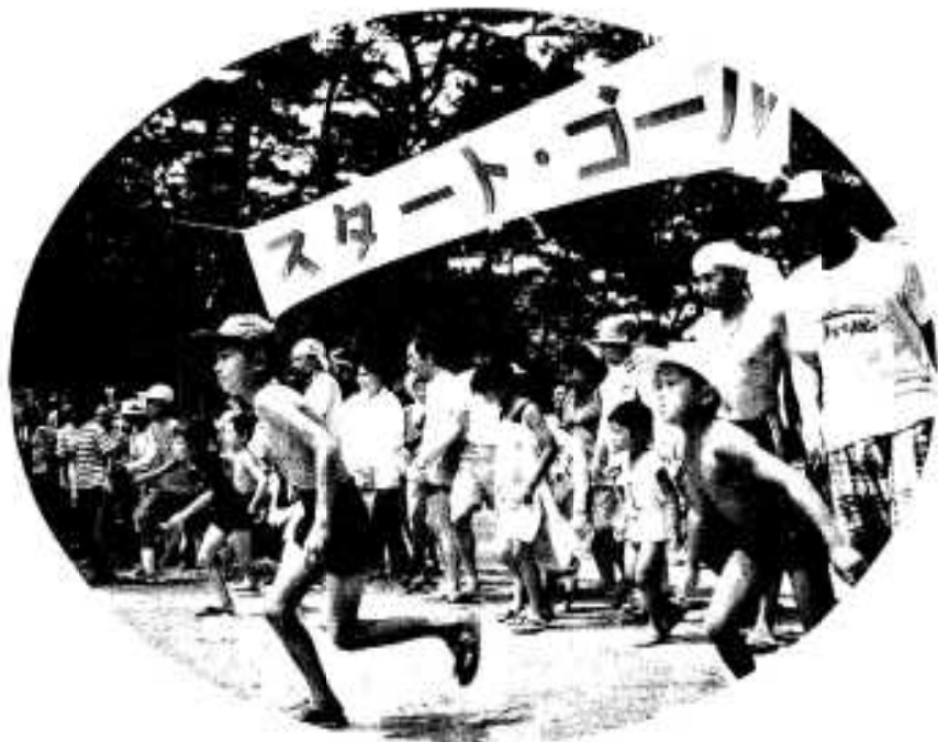
お宝を探しにスタート。「トレジャーハンティング」

七月十九日の三万人クリーン作戦から始まった「みどこい祭り」は、各イベントとも多くの方々が訪れ、たいへんにぎわいました。 そこで、八月一日までの各イベントの状況を写真で振り返ってお届けします。