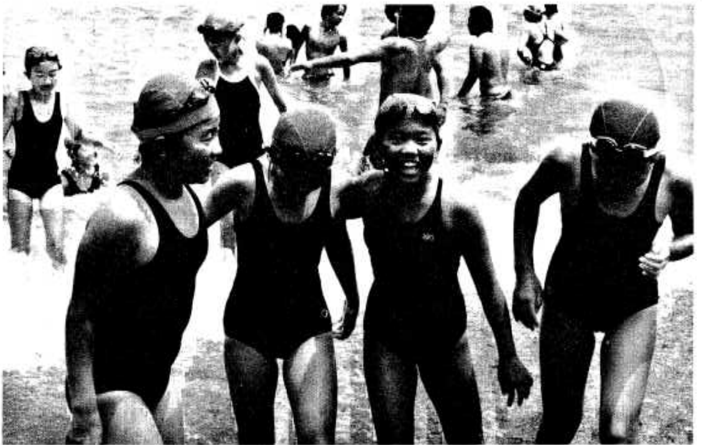
(海の子カーニバル)

●●●● 編集・発行／阿久根市役所 総務課 〒899-1696 鹿児島県阿久根市鶴見町200番地