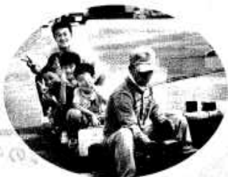
ミニSは 子どもに大人気

七月十九日の三万人クリーン作戦から始まった「みどこい祭り」は、各イベントとも多くの方々が訪れ、たいへんにぎわいました。 そこで、八月一日までの各イベントの状況を写真で振り返ってお届けします。