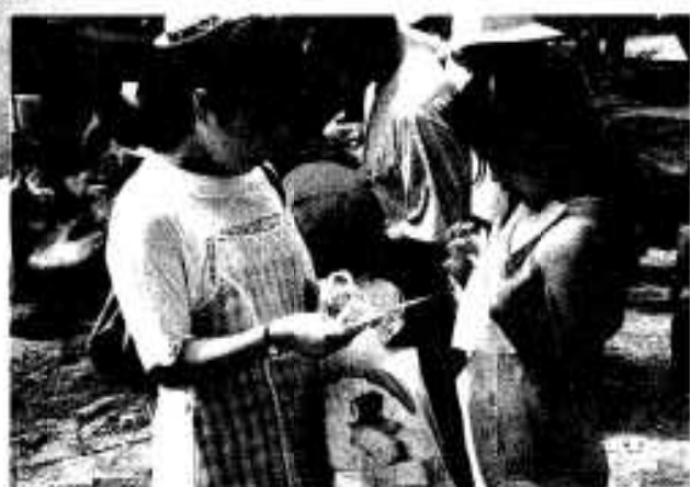
「こういう時はお母さんにまかせなさい」