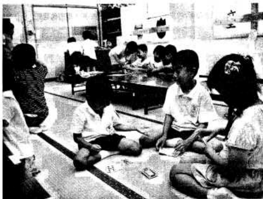
(写真は阿久根学童クラブ)

市では本年四月から新規事業として、「学童クラブ」を開設し、心身ともに健康で情緒豊かな子どもを育てようと、集団的、個人的指導を行っています。