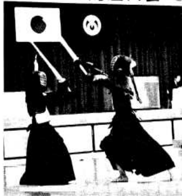
迫熱した試合展開の男子決勝戦