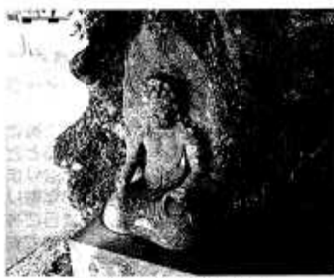
高松区の火の神石像