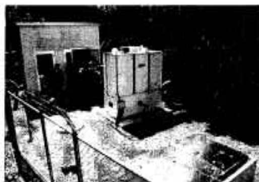
弓木野地区給水施設

今まではばつなどで生活用水に困った時期もあっただけに、今回の施設が完成したことで不安が解消され、住民の方々は大へん喜んでいました。