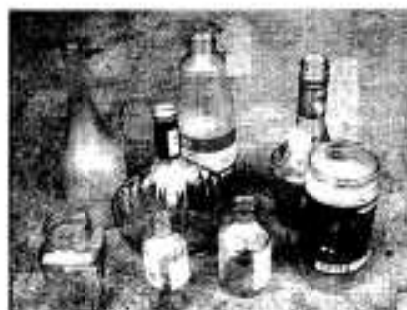
無色透明なびん類