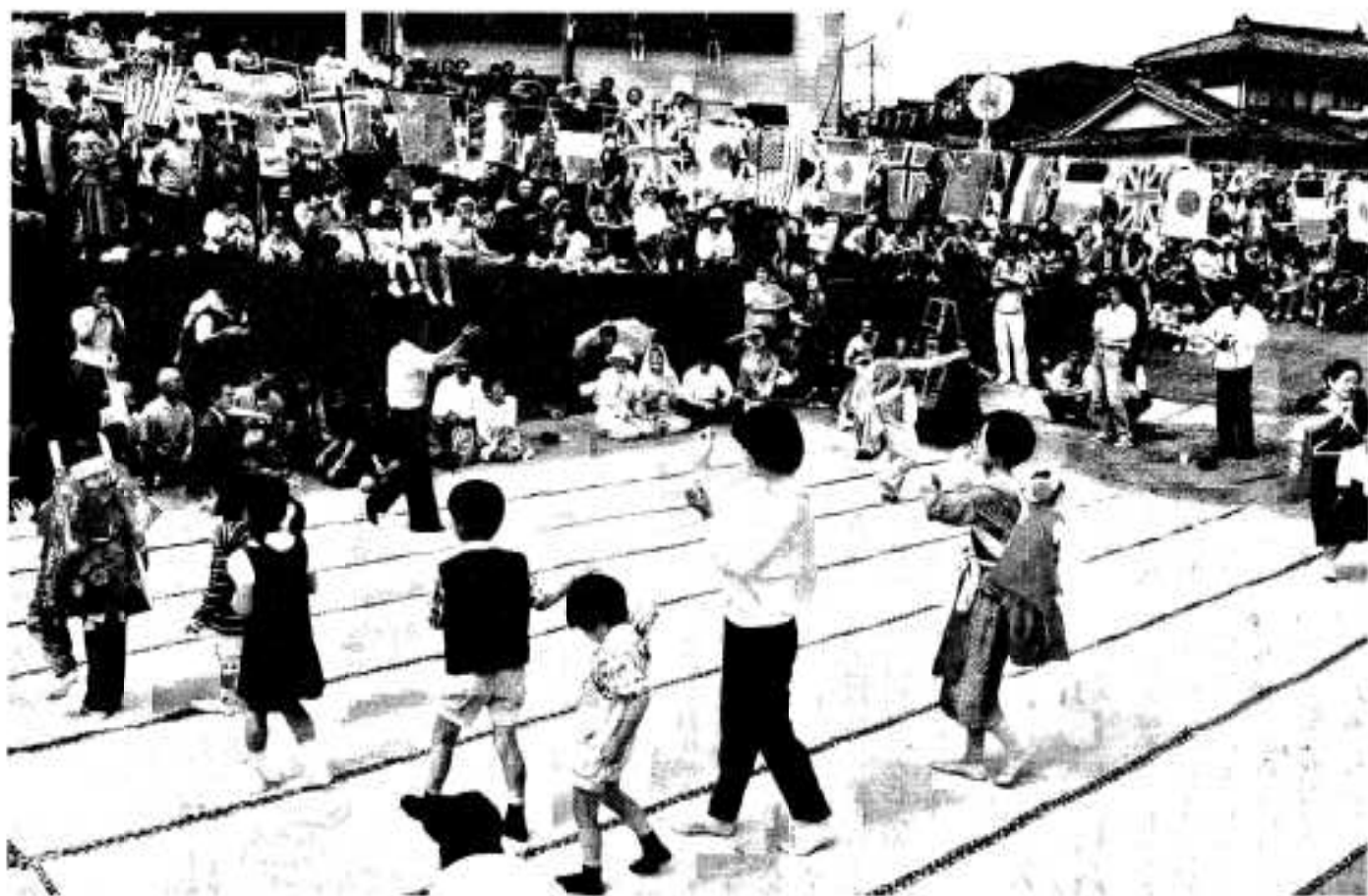
(佐潟区ひな女まつり)

●●●●編集・発行／阿久根市役所 総務課 〒899-1696 鹿児島県阿久根市鶴見町200番地