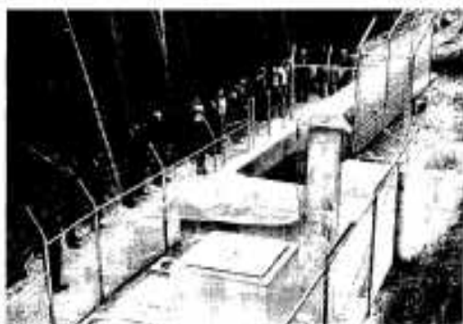
尾原地区給水施設

に発生した地震により今まで生活用水に使用していた個人の井戸が枯渇し、早急な震災の復旧と衛生的な生活用水の確保が求められていました。そこで、新たに給水施設を設置したもので、