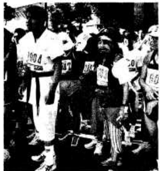
さまざまなユニホームも登場