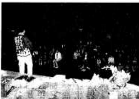
「次は私の番号かな」お楽しみ抽選会

るおゆうぎや丸太切り大会、郷土芸能として尾崎小学校と山下小学校による三尺棒踊り、脇本小学校と三笠中学校による山田楽がそれぞれ披露されました。そのほか、市民会館大ホール