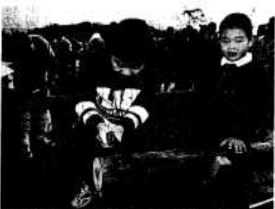
「思うように切れないよ」丸太きり大会

では産業祭の名物となった抽選会も行われ、電気ストーブやお米、ボンカンなどの様々な賞品が準備され、番号が読み上げられるたびにため息と歓声があがっていました。