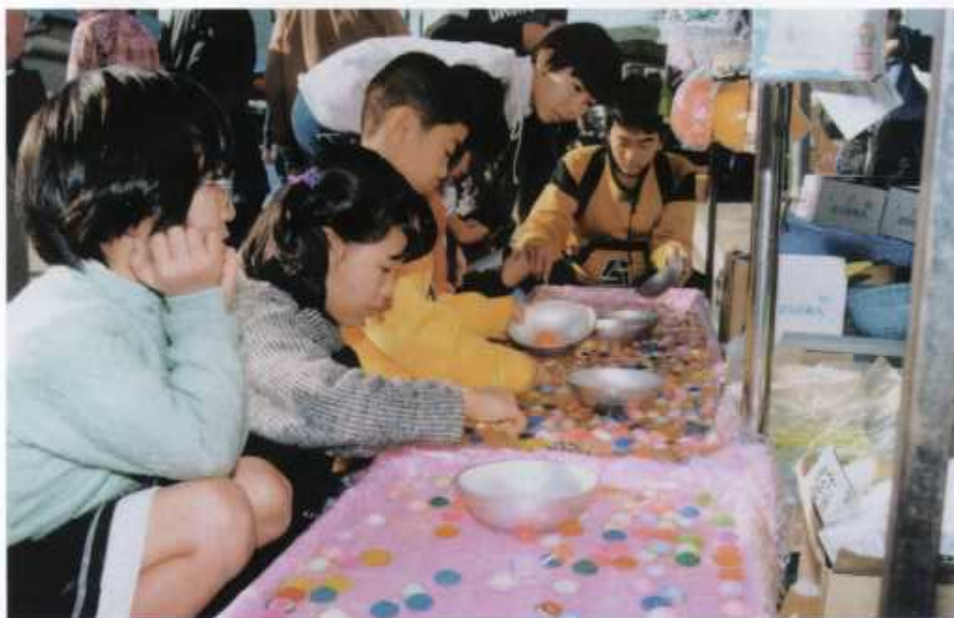
(本町通りよごれ市)

編集・発行／阿久根市役所 総務課 〒899-16 鹿児島県阿久根市鶴見町200番地