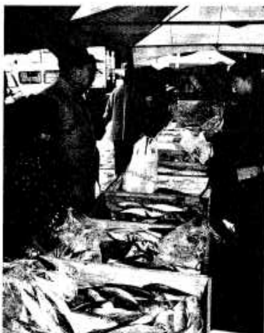
鮮魚も安いよ！安いよ！

年末の恒例行事となった「第26回阿久根市産業祭（アクネうまいネ・自然だネまつり）」が十二月二十日と二十一日の両日、市民体育館及び市民会館で開催され、多くの方々で賑わいました。 市内の生産物が一堂に勢ぞろいし、しかも、市価よりも安く購入できるとあって市内はもとろん、市外からも訪れる方もいました。 展示・即売の会場となった市