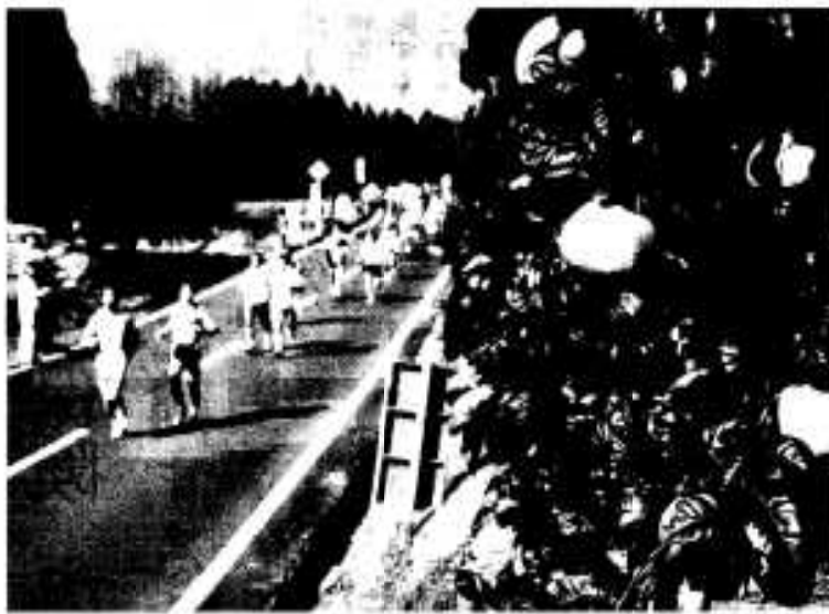
ポンタンも応援しているよ