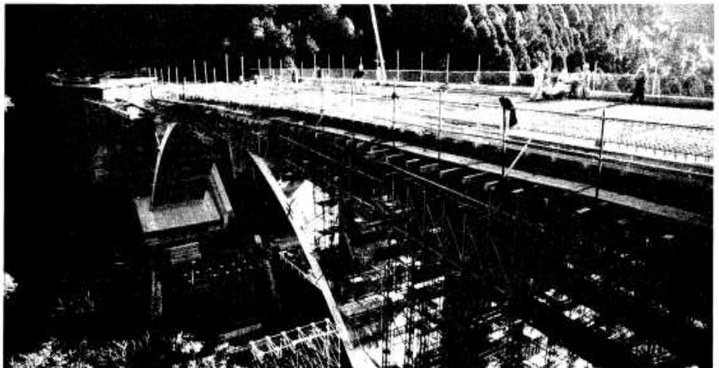
順調に工事がすすむ県道阿久根東郷線

平成十年は皆さまにとりまして素晴らしい一年でありますとともに、限りないご多幸を祈念し、年頭に当たりましてのごあいさついたします。