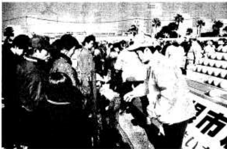
恒例のポンタンピラミッドのポンタンプレゼント