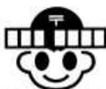
郵便番号キャラクター「ポストン」