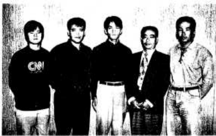
中国へ派遣された研修生の皆さん