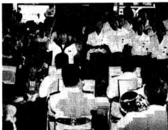
音楽隊の演奏により鶴川内中学校の校歌を合唱

この大会は交通安全協会鶴川内・山下支部と山手五校PTA連絡会が主催したもので、鶴川内地区では初めて開催されました。始めに阿久根警察署長や交通安全協会会長などがあいさつして、市内の交通事故の現状や高齢者、子どもが被害者となることが多いなどと説明しました。そして、腹話術の人形を使った交通安全教室があり、交通事故の防止を呼びかけるとともに鶴