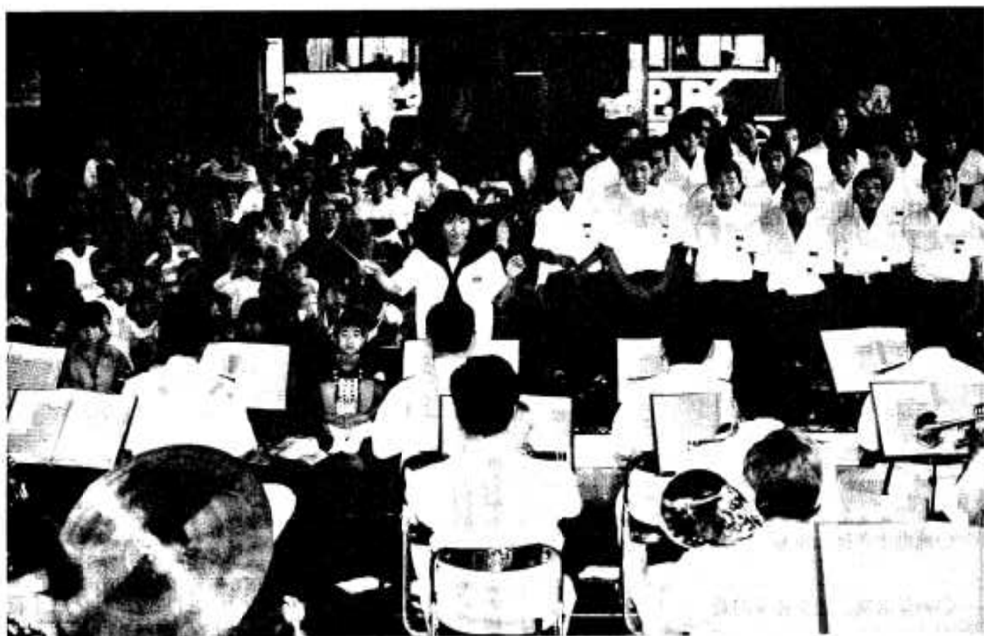
(鶴川内中学校にて：4ページに関連記事)

●●●●編集・発行／阿久根市役所 総務課 〒899-16 鹿児島県阿久根市鶴見町200番地