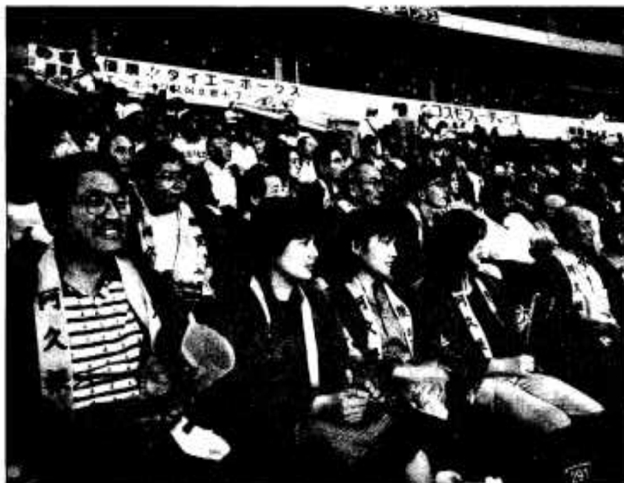
熱烈な応援をした参加者

しかし、ダイエーホークスは九州の球団であるため「九州の球団は九州内でキャンプを」と当市他に誘致に名乗りをあげている都市も数カ所あり、行動に移そうとしている状況です。このことで、いかにキャンプ誘