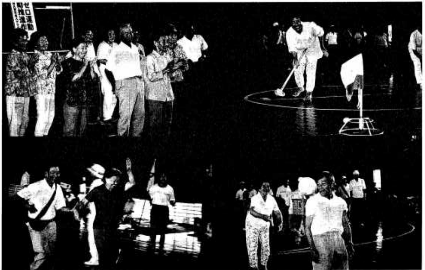
(脇本地区老人クラブスポーツ大会)

●●●●編集・発行／阿久根市役所 総務課 〒899-16 鹿児島県阿久根市鶴見町200番地