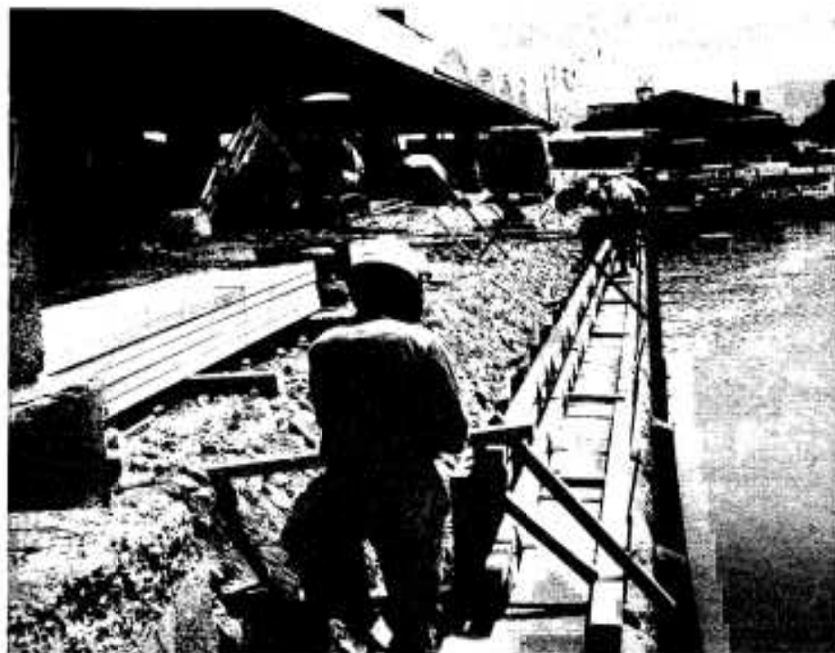
工事が始まった本港区