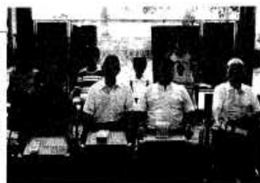
受賞された皆さん