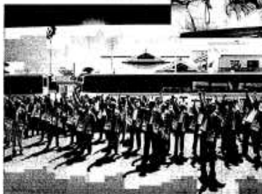
出発前の「ガンバロー」