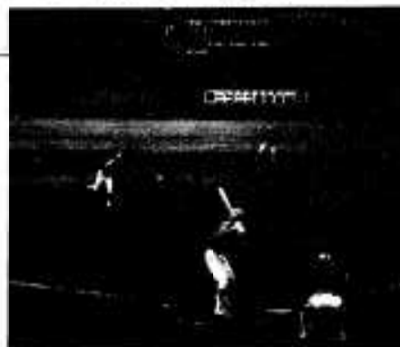
設備の整った 総合運動公園

ダイエーホークスの秋季キャンプは本年まで高知県高知市で行うことになっておりますが、来年はその球場が工事のため使用できなくなるため、他の地を探すこととなります。