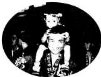
「ねえー、ちゃんとおどってるの?」