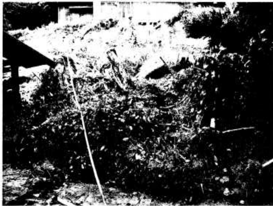
牛之浜地区で発生したガケ崩れ

七月六日から十二日までの総雨量が五百ミリを 超すという猛烈な雨量を観測した豪雨で、七月 十日未明、出水市では死者二十一人を出す災害 が発生しました。 阿久根市では大きな被害はなかったものの、 出水市の災害発生現場は砂防ダムが間もなく完 成するという、言わばこれほどの被害を予測さ れていなかった場所です。 今一度、自宅周辺を再確認しましょう。