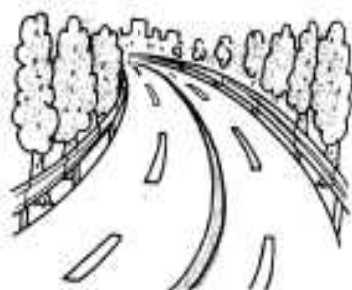
8月は道路を守る月間