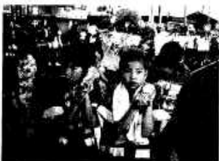
「ワッショイ・ワッショイ」子どもみこし