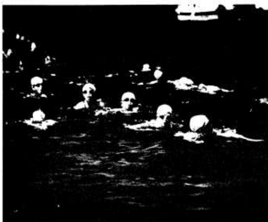
「ソーレ、ソーレ」ゴールはもうすぐだ!

にちなんで行っているもので、遠泳をおして海のたくましさをもつて体験し、心身を鍛えて忍耐を養おうというもので、第十三回目を迎えた今年には市内