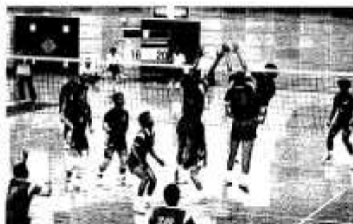
総合優勝がかかった男子バレー決勝