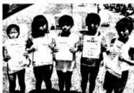
4年生もガンバリました