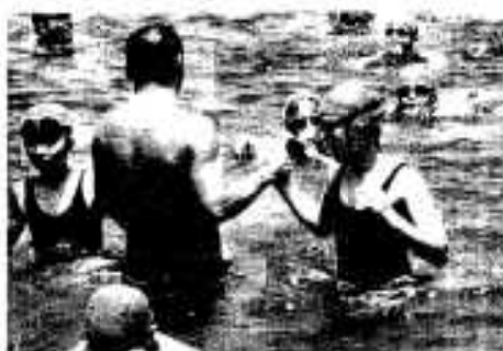
指導員とがっちり握手

の小学校四年生から六年生までの六十一人が挑戦しました。花火を合図に阿久根大島を順番にスタート。海上は台風の影響により少し波が高く、泳ぎにくそうでしたが、高校生や指導員にサポートされながら、「ソーレ、ソーレ」と声を掛け合いながら懸命に泳ぎ続け、出発から約二時間後に先頭が海岸へ到