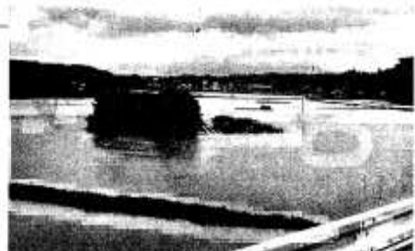
大雨で冠水した 筒田地区の田