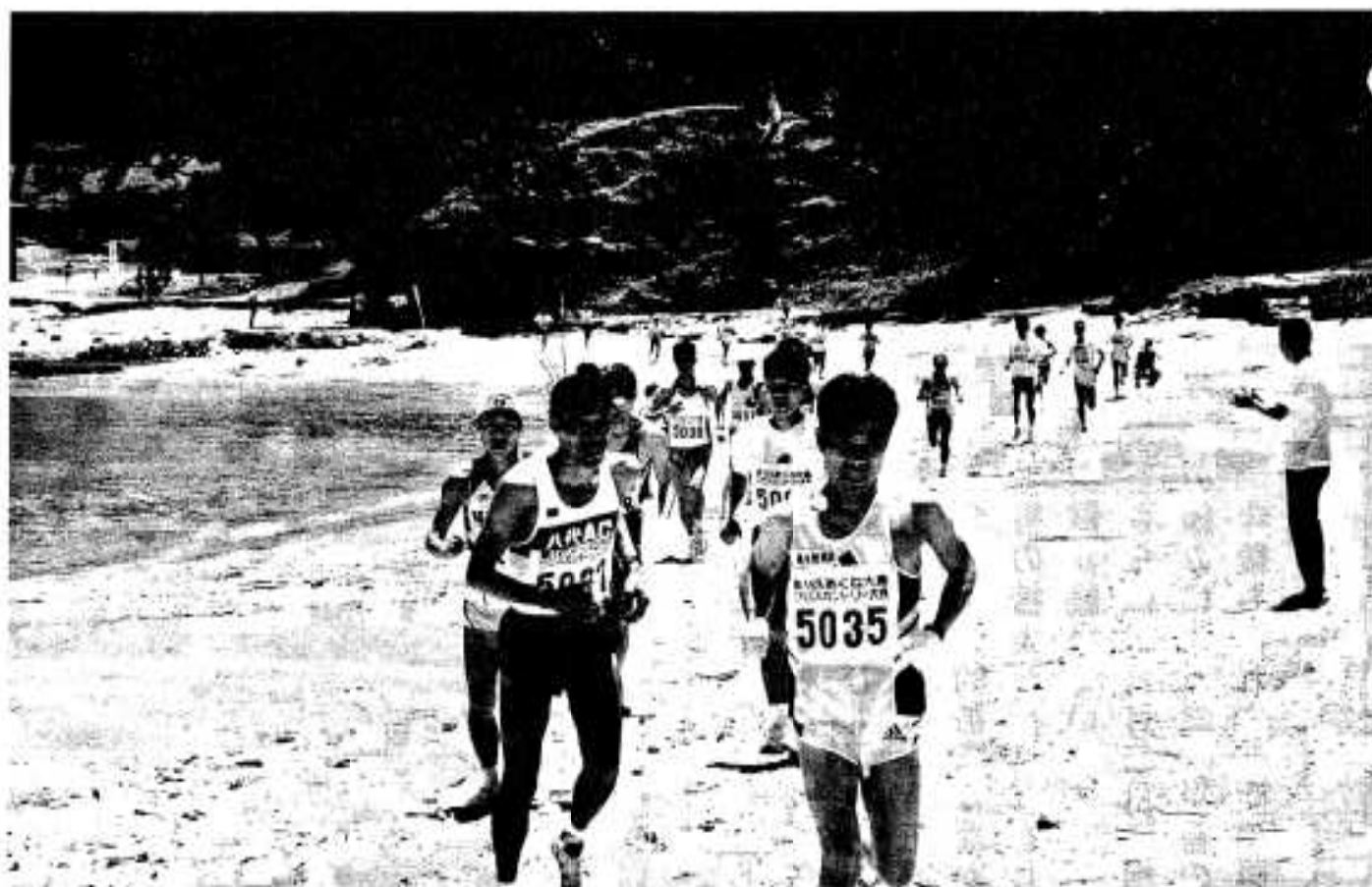
(阿久根大島クロスカントリー大会)

●●●● 編集・発行／阿久根市役所 総務課 〒899-16 鹿児島県阿久根市鶴見町200番地