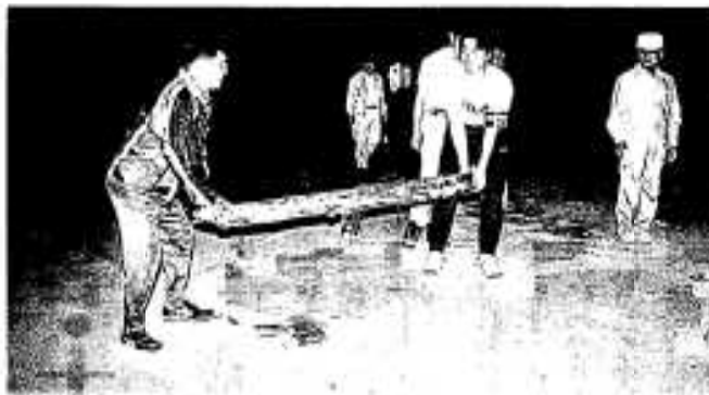
上陸地付近を点検する監視員たち

ウミガメは絶滅の危機にあることから、その保護対策が世界的に展開されており、日本においても環境庁が「希少種」として位置づけています。県でも昭和六十三年に「ウミガメ保護条