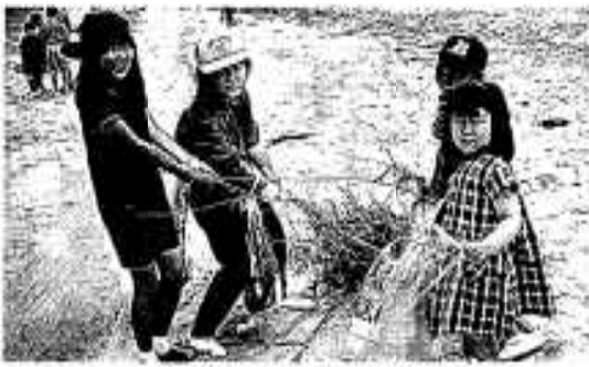
海岸を清掃する参加者

美しい海や環境問題を考えようとして外国語指導助手（ALT）たちが中心となり五月十一日、