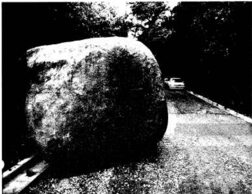
(いこいの森付近で大きな落石)