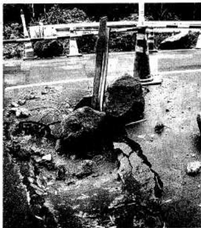
弓木野区で落石により道路が陥没

三月二十六日に発生した地震が、概ね終息に向かっていると思われた矢先の五月十三日に、大きな揺れが再び北薩地方を襲いました。