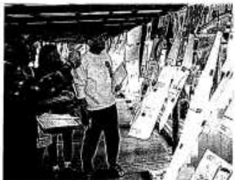
多数のポスターを展示

参加したのは市内の小・中学生やその保護者ら約二百人で、まず、参加者全員で海岸の清掃をしたところ、流木や海藻などの自然のもののほか、ビニール袋やプラスチック容器など、海に捨てられたと思われる「ゴミ」のあまりの多さに、作業をした参加者はびびり、午前中かかって汗びっしょりになりながら作業を行いました。 そして、県内の小、中、高校の児童、生徒から応募があった環境問題に関するポスターコン