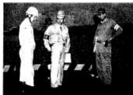
国土庁などの視察

況は、人的被害が軽傷八人、住宅被害二百一棟、非住宅三十七棟、ブロック塀三十七件、公共施設被害額は約十一億九千九百万円になるとみられ、商工業や農林水産業等の被害額は推計で約五千五百四十万円に上ります。