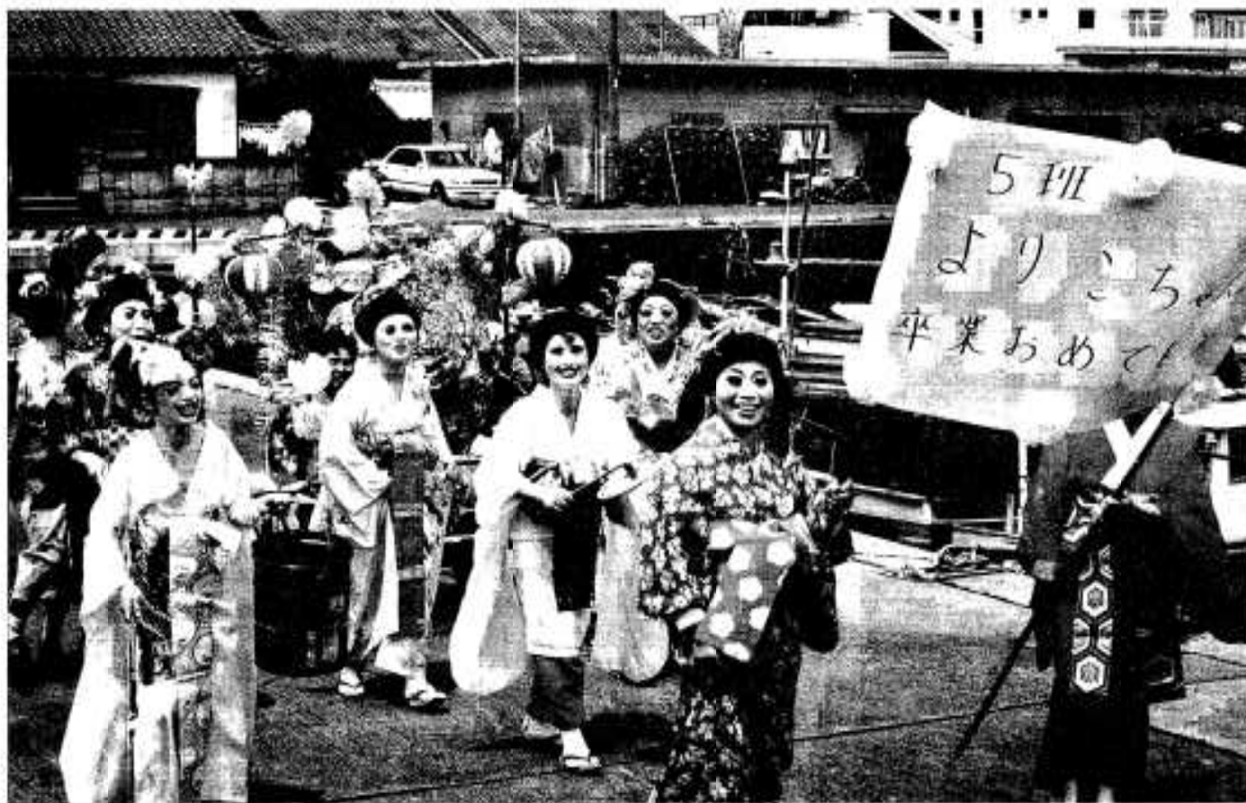
(倉津区婦人会卒業式)

●●●●編集・発行/阿久根市役所 総務課 〒899-16 鹿児島県阿久根市鶴見町200番地