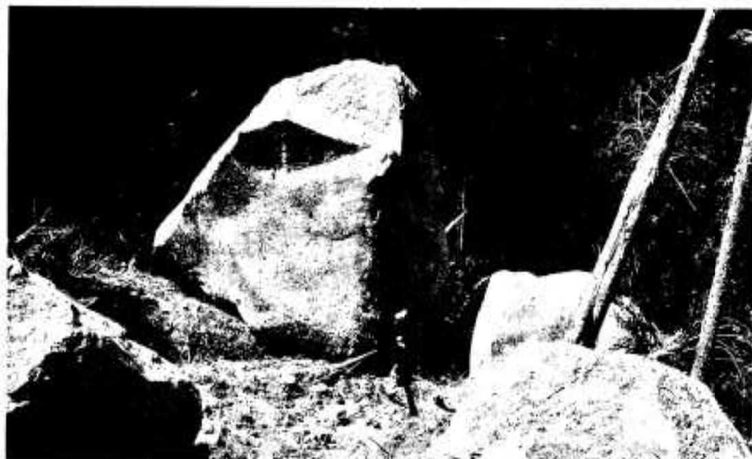
いこいの森で巨石が落下

三月二十六日午後五時三十一分、突然の縦揺れに続き震度五強という激しい横揺れが阿久根市を襲いました。その後、余震が頻繁に続き、四月三日午前四時三十三分には震度五弱の最大余震を記録しました。