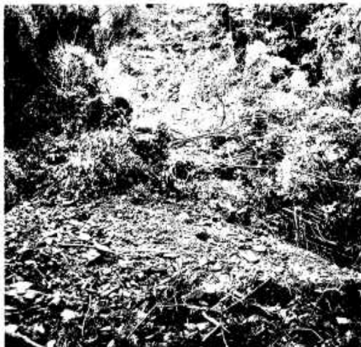
頂上付近からくずれ落ちた尾原区の現場