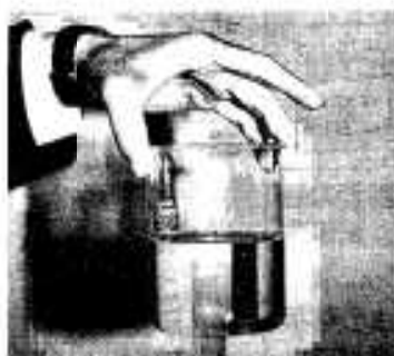
高度処理された放流水