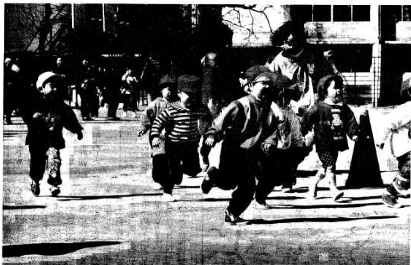
(脇本保育所マラソン大会)

●●●●編集・発行／阿久根市役所 総務課 〒899-16 鹿児島県阿久根市鶴見町200番地