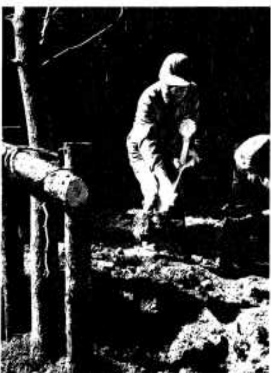
参加者による記念植樹

資源の保全や林業生産の活性化をアピールしました。 なお、当市の表彰者は次のとおりです。 ※敬称略 ▽林業功労者（出水農林事務所 長表彰）