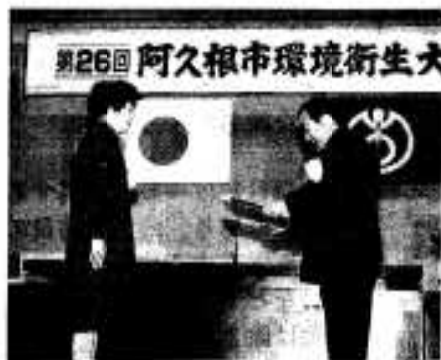
第26回阿久根市環境衛生大会