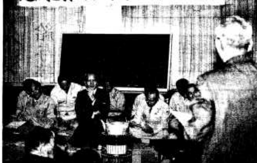
会場からは活発な意見が出されました