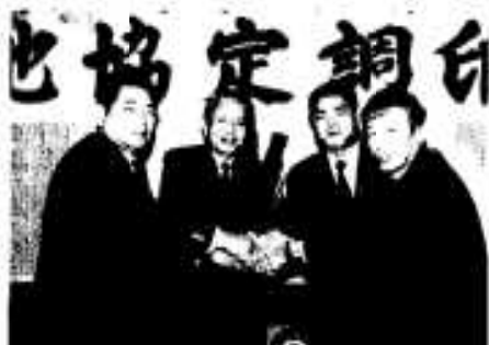
調印式で市長と倉津会長ら

市は市内波留の広域農道沿いにある鹿児島金属(株)と一月十四日、新工場増設にともなう立地協定を締結しました。