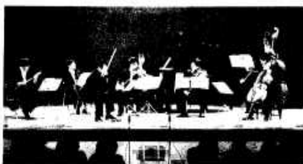
見事な演奏の8名によるアンサンブル

平成九年の新春をすばらしい音楽で幕開けしようと十一月十一日、市民会館でクラシックコンサートが開催されました。 このコンサートは市が主催し、全国のトップクラスのNHK交響楽団から八名の方を招いて、アンサンブルで行われました。