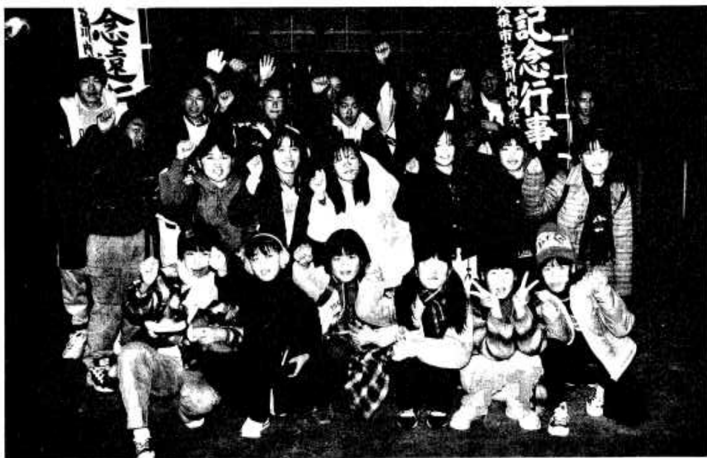
(鶴川内中学校：立志記念行事)

●●●●編集・発行／阿久根市役所 総務課 〒899-16 鹿児島県阿久根市鶴見町200番地