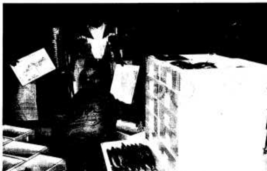
東京へ向け鮮魚バックを発送

「アクネ うまいネ 自然だネ」のキャッチフレーズを掲げた阿久根の特産品が、東京都内の大手スーパーで四日間にわたり販売されました。また、全国発行の生活情報誌で特産品が四ページにわたり掲載され、誌上ショッピングも行われました。