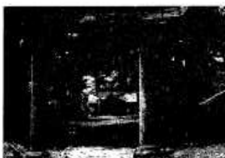
阿久根大島の鳥居

のほかは、金刀比羅神社の鳥居の柱と同じ家族名がきざまれ七十余年を経たいまも両神社の門として多くの人々の参拝を見守っています。