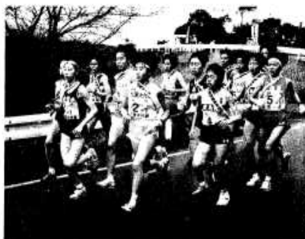
(写真は昨年の様子)

全国高校駅伝のトップクラスの高校が参加し、毎回熱戦が展開されている「阿久根市長旗 九州選抜高等学校駅伝競走大会」が開催されます。