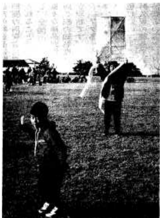
「お母さん、しっかりもってよ」

（財）阿久根市美しい海の街づくり公社が主催する第三回新春たこあげ大会が一月十二日、番所丘公園多目的広場で開催され、多数の参加者でにぎわいました。 この大会は広い公園を使い、家族で楽しんでもらおうと開かれたもので、また、小学校では冬休みの課題にたこ作りがあることもあって年々参加者が増えています。 当日は青空が広がったうえ、たこあげにはほどよい風が吹く絶好の天気にも恵まれました。開会式が終わると、早速自作のたこの出来ぐあいを審査。そして、小学校三年生以下と四年生以上に分かれてたこが揚げられました。冬休み期間中に父母の協力をもって作ったという子ども