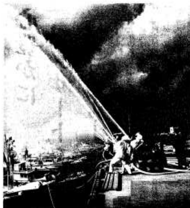
消防団員による一斉放水

新春恒例の消防出初式が一月六日、消防団員や消防署員が参加して開催されました。式では多くの市民や消防後援会関係者が見守るなか、団員や署員による機械器具点検や通常点検、ポンプ操法などが行われ