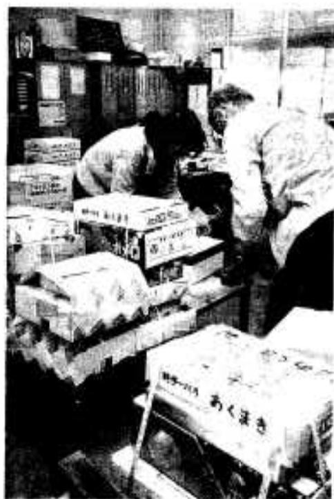
全国に向け商品を発送