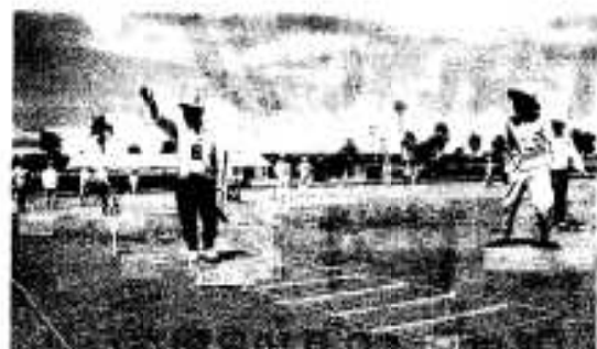
猛暑の中熱戦を展開

第十七回目の交通安全ゲートボール大会が七月三十一日、市総合運動公園で開かれ熱戦が展開されました。