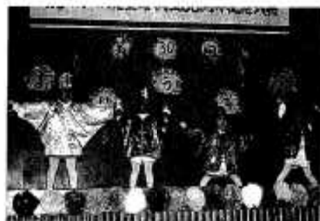
かわいらしい園児たちの踊り

式典では歴代の後援会長として協力していただいた方々に感謝状が贈られ、その後児童らのお遊戯が披露されました。この日のために一生懸命練習してきた児童は、ステージの幕が上がると笑顔で登場。見守る父母らに笑顔をふりまいていました。