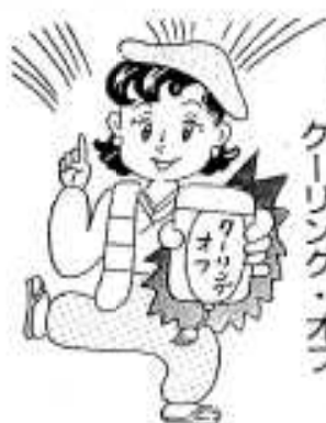
⑦ 八日間使える奥の手 クーリング・オフ