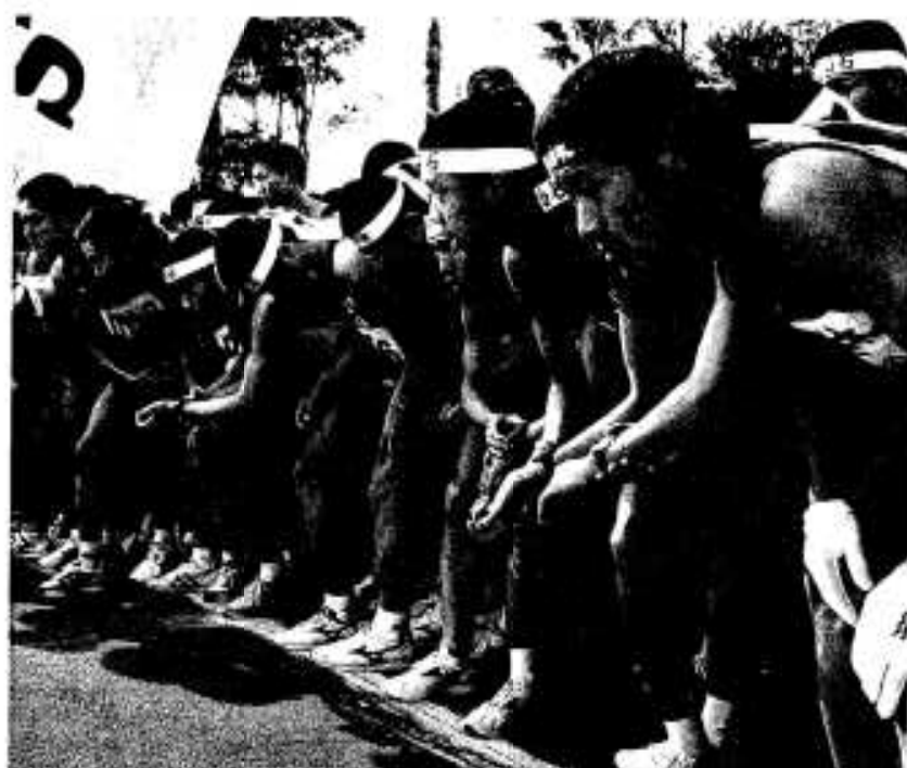
緊張のスタート前

絶好のランニング日和に恵まれて、「第十二回ボンタンロードレース大会」が十二月十日、阿久根市総合運動公園を中心に開催され、約三千五百人が参加し健脚を競いました。 全国的にも知られるようになった今大会には、九州はもとより遠くは北海道や福井県からの参加もありました。競技は3 km 、5 km 、10 km 、フルマラソンの四種目で六グループに分けて出発。参加した選手はそれぞれのペースでボンタン路を駆け抜けました。 レース終了後はスポーツドリンクやお茶、漬物、丸干しイワシなどでもてなされ、疲れた体を癒しました。