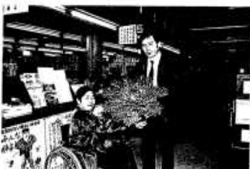
多くの人で賑わった駅前通り会のチャリティーもちつき大会

脇本の重度身体障害者施設「愛和園」の園生が丹精込めて栽培した“葉牡丹”が、今年も市役所に送られました。「愛和園」では園生の生きがい事業の一環として六年前から行っているもので、八月に種をまき育てていました。「日ごろお世話になっている皆さんへお礼に」と、市内では警察署や図書館など35ヶ所の事業所や地域に配付されました。