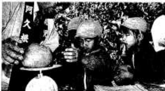
ボクのが一番大きいはず!!

本市のシンボルともなっているボンタンを広く知ってもらおうと毎年開催しているもので、産地である尾崎区の農園を借り上げ実施しています。天候に恵まれた当日は運華保育園バラ組の園児と観光協会会長が「ボンタンは果物の王様。みなさんの顔よりも大きく、日本で一番たくさん収穫できるのがここです」とあいさつし、開園をお祝いでテープカット。そして園児たちはさっそく来園したお客さんと一緒にボンタン狩りを楽しみました。