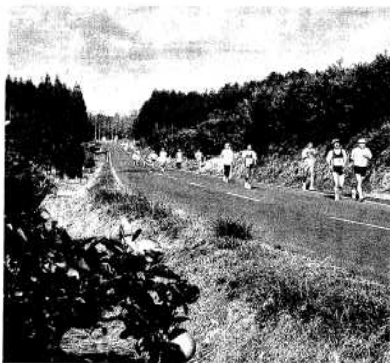
ボンタン路を快走