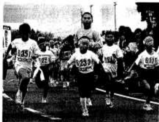
ガンバレ!! あと少し