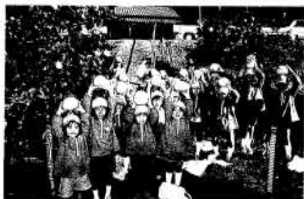
はじめてボンタンを採ったよ