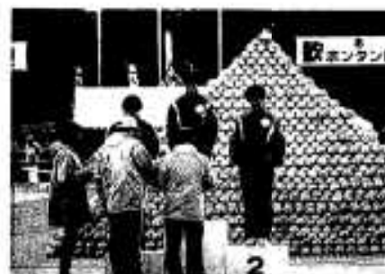
ボンタンピラミッド前での表彰