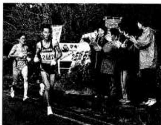
住民の応援を受けての力走!!