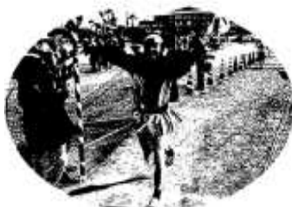
海賊さんもゴール