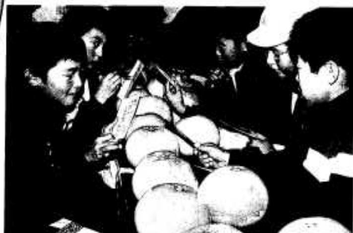
このポンタンも良さそうだな～