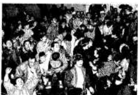
賞品があつた幸福もち投げ

市民会館大ホールでは園児らによるお遊戯や阿久根中学校吹奏楽部による演奏会、様々な商品が当たる幸福モチ投げが催されました。 本市の年の瀬を飾るお祭りとして会場内は終日、親子連れや大きな包みを抱えた人たちで賑わいました。