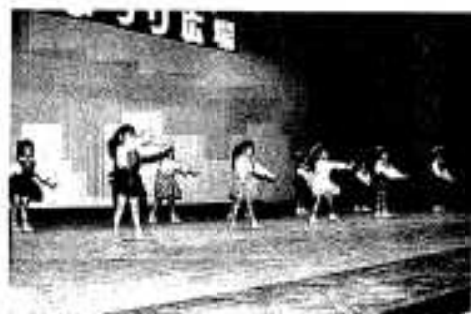
園児たちによるお遊戯

会場には特産品をはじめ農水産物、産工業品、各種加工品が展示即売され、また、うどんや焼き鳥などの飲食コーナーもありました。展示コーナーでは施設やグループの活動内容の紹介、住宅の無料相談やボンタン、タケノコなどの農産物優秀作品も飾られ、訪れた市民は見事なまでに興味深げに見入っていました。