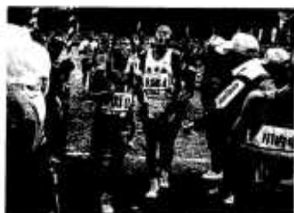
好記録が出たかな？