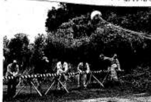
丸太カットで開通を祝う関係者