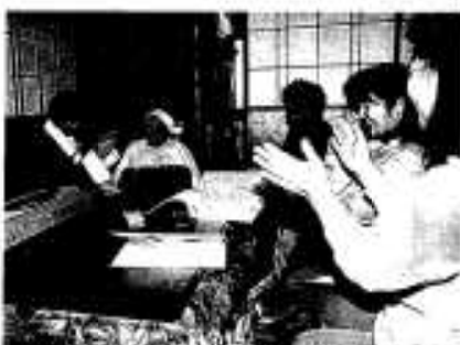
楽しくて元気が出ました

となごやかな雰囲気慣れ、笑顔でいっしょに歌を歌いました。思わぬプレゼントを贈られたお年寄りや家族の方は大変喜ばれ、今後もしハピリに頑張っていく決意を話してくださいました。