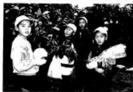
この大きいのはボクのだよ

きましたが、一年生はワラが手につかないようで、お年寄りの作り方を見たり聞いたりしながら作成。足先でワラの一方を固定しながらワラを束ね、一時間ほどで何とか、しめ縄らしくなりました。出来上がったしめ縄は家に持ち帰り、正月の玄関飾りになりました。