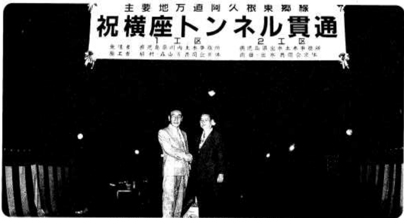
昨年8月に貫通した横座トンネルでの貫通式

1 区 2 区 鹿児島市 川内市 土佐市 阿久根市 東郷町 出水市 横座町 土佐市 阿久根市 東郷町