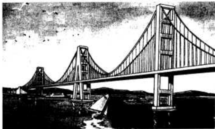
長島・天草・島原架橋

は①九州西岸輪構想の柱として、第五次全国総合開発計画の中に組み入れる②架橋構想実現に向けて調査を継続して実施し、などを盛り込んだ大会宣言を全会一致で採択しました。参加者は全員が「早期実現」と染め抜かれたハチマキを締め、最後に「がんばろう」と力強く三唱して大会を終わりました。