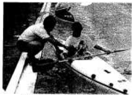
こんな持ちかたでいいの？

どの試合も点差のない白熱した試合が展開されました。普段金力で走ることにないどのチームの選手もあちこちが痛むなか、笑いと悲痛の聲がとびかう、な