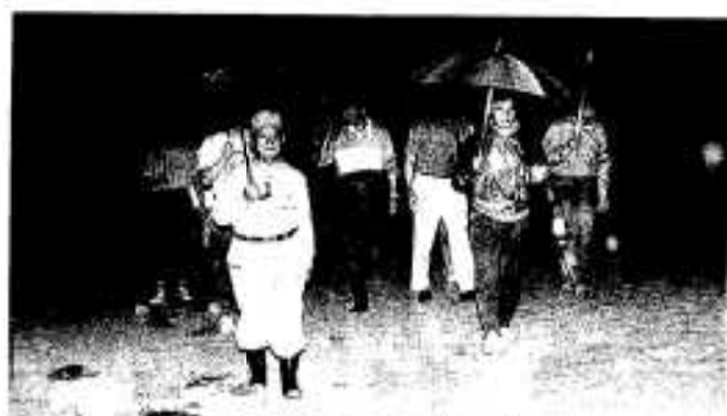
夜の海をパトロールする関係者