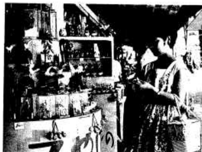
昭和40年ごろの大島のみやげ物店

こともありました。昭和四十七年七月二十六日正午すぎこの売店通りで火事が発生、消火施設がなかったため市では会場保安部の巡視船「あやなみ」に出動を要請し約五十人が消火に向かいましたが着いたときには既に五むねが全焼していました。今年開設六十周年大島は見事に変身しています。