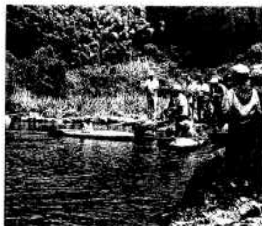
流れがあってもずかしいぞ