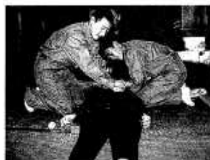
命を救う人工呼吸も体験

生徒は各事業所で、電子部品の製作や土木作業、施設のヘルパーを経験し仕事の厳しさや、喜びも味わり、将来の職業選択に大いに役立つのではないのでしょうか。