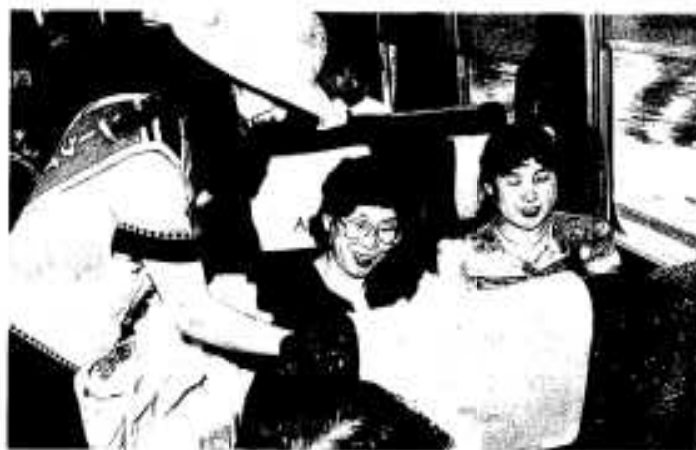
「阿久根市へおいで下さい」とPRするシークイーン

「海がきれいらしいですね。ぜひ行ってみたいですね」と笑顔で答えていました。 列車内はほぼ満席状態で、宣伝隊は冷房が効いた車内も汗だくになりながら、用意した八百セットを配布しました。