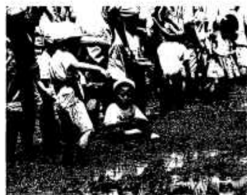
だれですか？子供を植えるのは