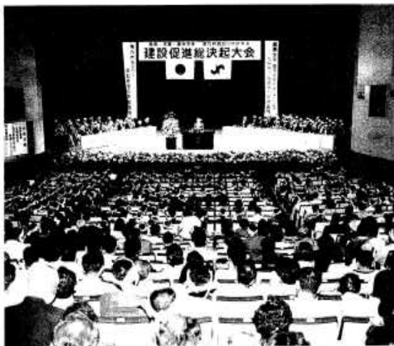
建設促進を願い、熱気に包まれた決起大会

南九州西回り自動車道と長島・天草・島原架橋（三県架橋）の早急な実現を目指して、「建設促進総決起大会」が六月二十四日、牛深市で開催されました。大会には阿久根市や出水市をはじめ、鹿兒島県・熊本県・長崎県内の関係市町から関係者約千三百人が参加し、西回り自動車道の早期事業化や三県架橋構想の実現へ向けて氣勢をあげました。