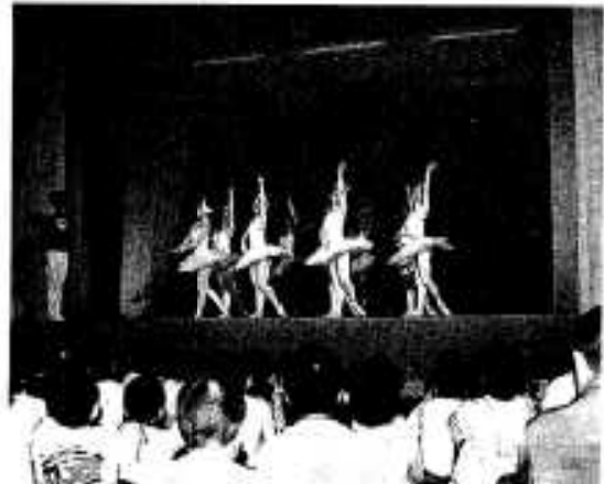
初めて見た人が多かった「白鳥の湖」

巡回劇場は青少年の皆さんが、優れた音楽や舞踏の鑑賞をとおして、舞台芸術に対する興味や関心を高めるとともに、豊かな感情をもつことを目的とするもので、今回の公演はバレエで県バレエ協会の方々を招いて行われました。