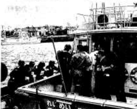
緊張した訓練風景

訓練は不審船をレーダーで追尾し、阿久根新港で密輸品を陸揚げしているところを逮捕するという想定。訓練といっても人員百六十一人、車両十七台、船