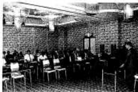
あいさつする新市市長

されました。不審な船や密漁者を見たらお近くの駐在所か警察署までご連絡ください。市民の皆様さまのご協力をお願いします。