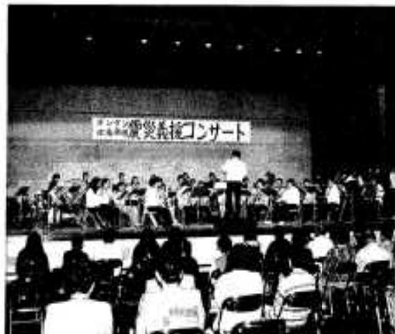
演奏中のポントアン吹奏楽団

会場入口には義援箱が置かれ入場する人は被災者に気持ちを贈りました。集まった義援金は社会福祉協議会を通じ被災者救援にあてられます。