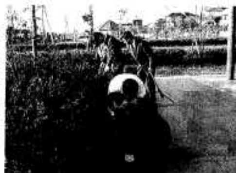
清掃作業する職員たち

その後、夕方には郵便局員約三十人が、新港前の漁港緑地環境施設でゴミなどを拾う奉仕作業を行い、「日頃お世話になっている市民の方々に少しでも恩