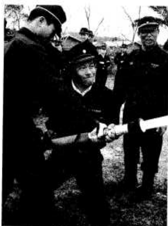
ホースを持つ手に力はいける!