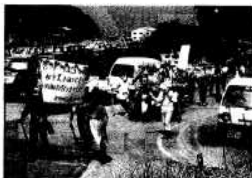
笑いが絶えなかった仮装行列