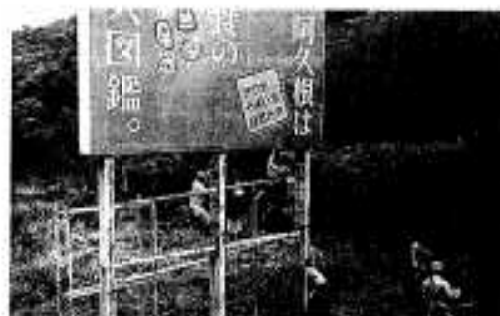
清掃作業する一六会のメンバー