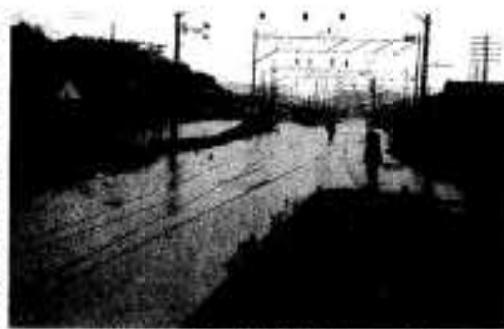
水につかる阿久根駅（S46年）

普通の雨は帯状に降り、狭い所で百、広いところで五百、ぐらゐと広範囲に渡りますが、集中豪雨の場合は、直径十からせいぜい数十、まで