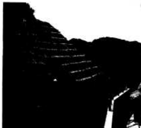
災害に備え整備が続く治山工事

集中豪雨によるがけ崩れや河川の洪水などの災害に巻き込まれないようにするために、どんなことに注意すればよいのでしょうか。