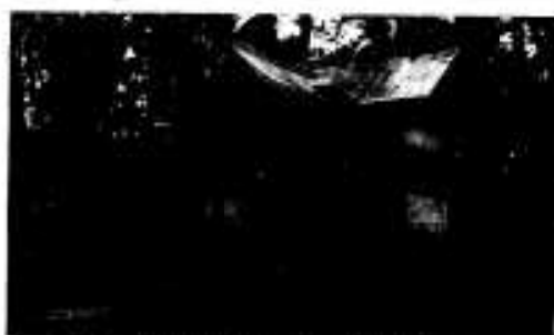
大島にある金比羅神社

旧三月十日は、金比羅神社の大祭で、阿久根以外からも参拝者が多く賑やかな祭りとして広く知られていました。大島に渡れない人々は海岸に遠拝所があつてここから拝みました。一年中で最も盛んな慰安日で往時は十一日十二日と三日間に亘り、この間、仙台萩・千本桜・忠臣蔵などの歌舞伎も上演されたといえます。戦後も二十年代までは花見といつて子ども一人一人