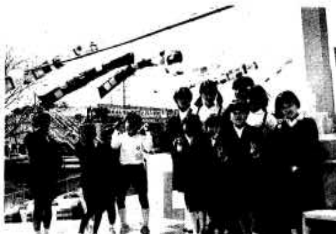
運転する人に交通安全を呼びかける「イワシのぼり」