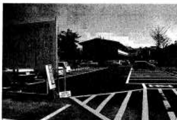
商店街活性化につながる市営駐車場