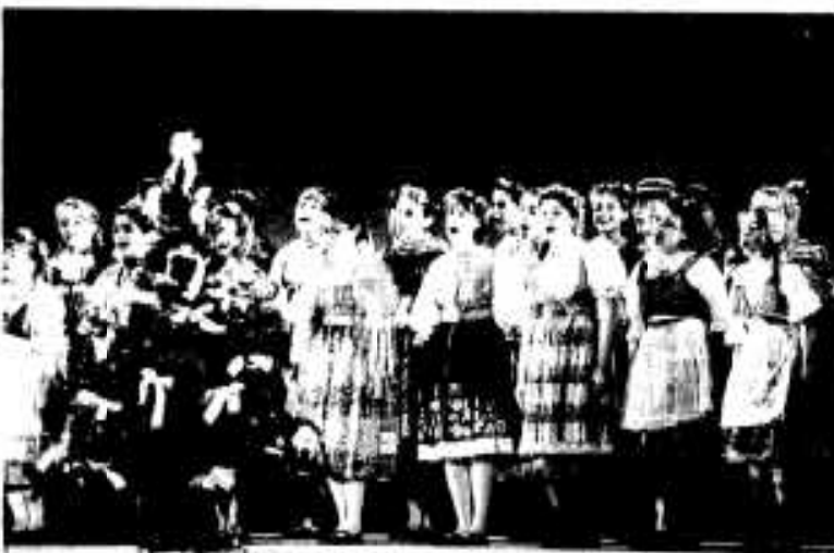
かわいらしい民族衣装をまとってのステージ