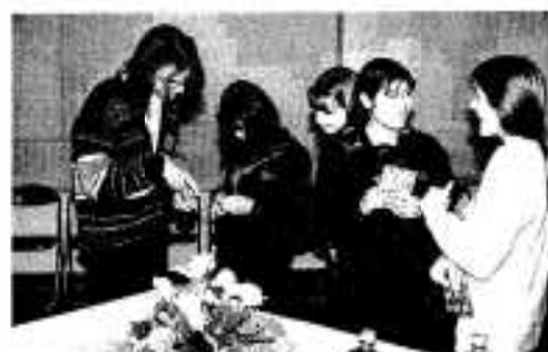
“音楽仲間” 言葉を越えて楽しく交歓

交流会にはブラハ合唱団の一行二十三人と阿久根中合唱部の二十人が出席。まずブラハの団員からポストカードがプレゼントされ交流会がスタート。本