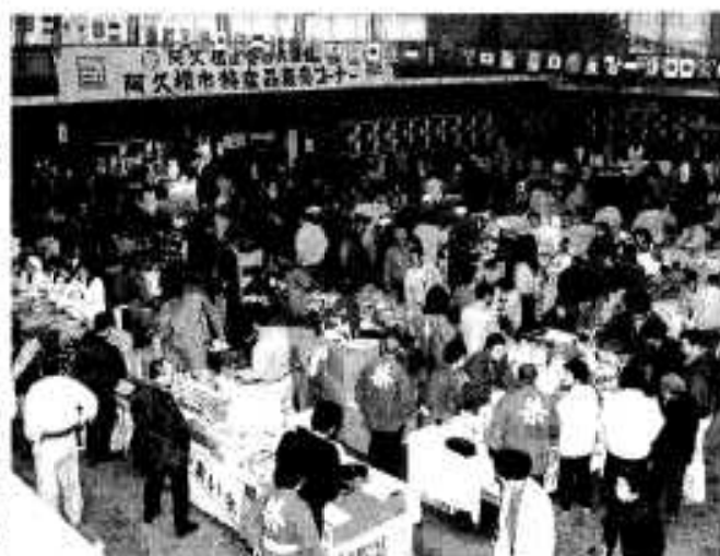
特産品販売コーナーは多くの市民でにぎわいました

年末年始の食料品、贈答品、生活用品が一度にそろった「アクネ うまいネ 自然だネまつり」が十二月二十四日と二十五日の両日、市民会館と市民体育館で開かれ多くの家族連れなどでにぎわいました。