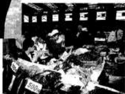
特産品フェア会場也大忙し

第十一回目を迎えたあくねボンタンロードレース大会は十二月十一日、市総合運動公園を発着点に三、五、十、フルマラソンの四コースで健脚が競われました。 今回は約三千五百人のジョギング愛好家らが参加。あいにく雨の中でのレースとなりましたが、参加者らは沿道の市民らの声援を受けながら精一杯の走りを見せてくれました。 ゴール付近ではお茶やジュースのほか、イワシやふかしもが提供され、ランナーらは冷えた体を温めていました。 コース脇では黄色くたわわに実ったボンタンが時折風にゆれ、駆け抜けていくランナーらを励ましていました。