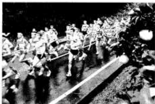
ボンタンロードを快走