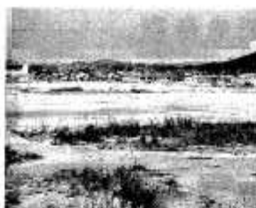
今は区画整備が進む潟土地

大正五年九月に鹿児島県は鶴や鳥類を愛護保存し、天然の風致を維持する目的でこの付近一帯を禁猟区にしました。大正十年三月には、天然記念物鶴渡来地として文部大臣指定の保護区となりました。