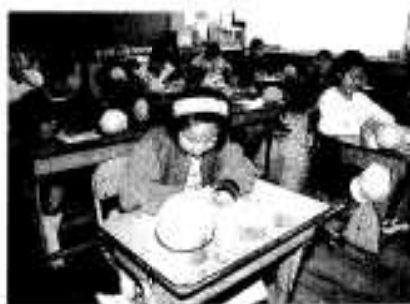
ポントタンをわきにイメージを膨らませる児童

また、この日審査を終えた児童らは学校に帰り、正月に出荷されるポントタンに添えて送る「ポントタン便り」を書きました。黄色く色づいたポントタンを机に置き、イメージを膨らませながら筆を運んでいました。