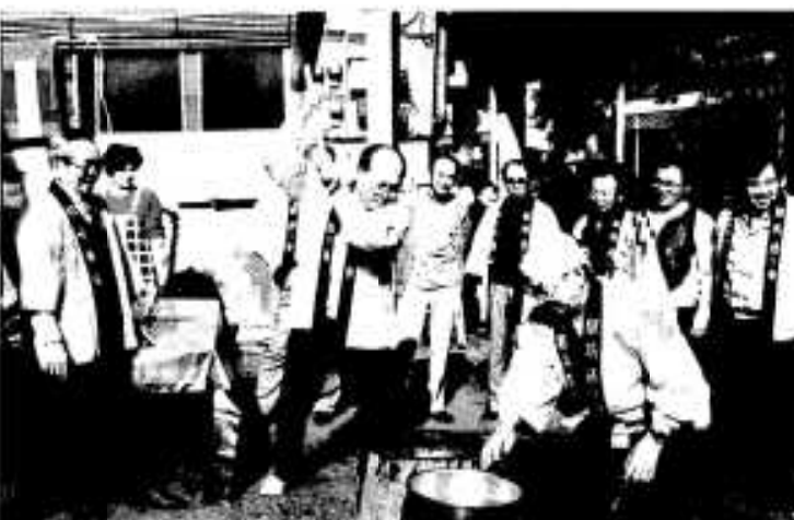
国道3号わきで行われたもちつき大会