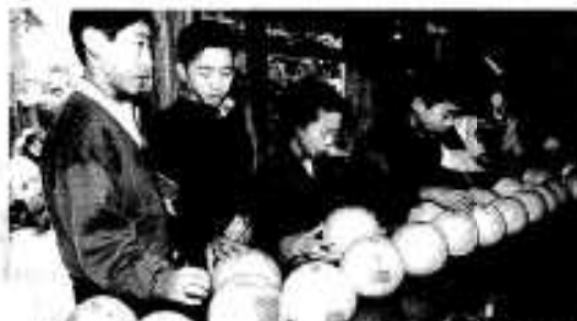
今年の出来をチェックするチビッ子審査員たち

特産ポントタンの主産地である尾崎区の公民館で十二月十六日、生産農家が丹精込めて育てたポントタンの品評会がありました。会には地元尾崎小の子供たちも参加し、形や色、つやに厳しい視線を注いでいました。