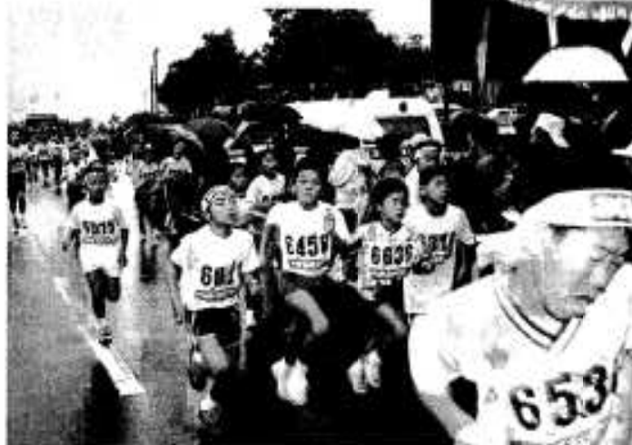
もう少しでゴール。がんばれ！