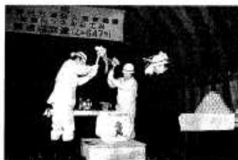
鏡割りをして到達を祝う

その後全員がトンネル先端に移動し、新市市長らによる鏡割りなどが行われ、到達を祝うとともにこれまでの工事関係者の労をねぎらいました。 本市側の工事は、最後の約百二十メートルが断層破砕帯と呼ばれる地質の悪い危険な部分があったものの、事故等もなくほぼ計画どおり掘削が終えられました。今後はトンネル壁面へのコンクリート吹き付けや照明、換気装置などの整備に工事が移ります。 同トンネルは昨年七月に建設省の「交流ふれあいトンネル・橋梁整備事業」の県内第一号に認定され、総事業費約二十八億円をかけて進められています。現在東郷町側からも掘削が行われており、今年の夏ころには貫通、そして来年の夏には開通を目標としています。