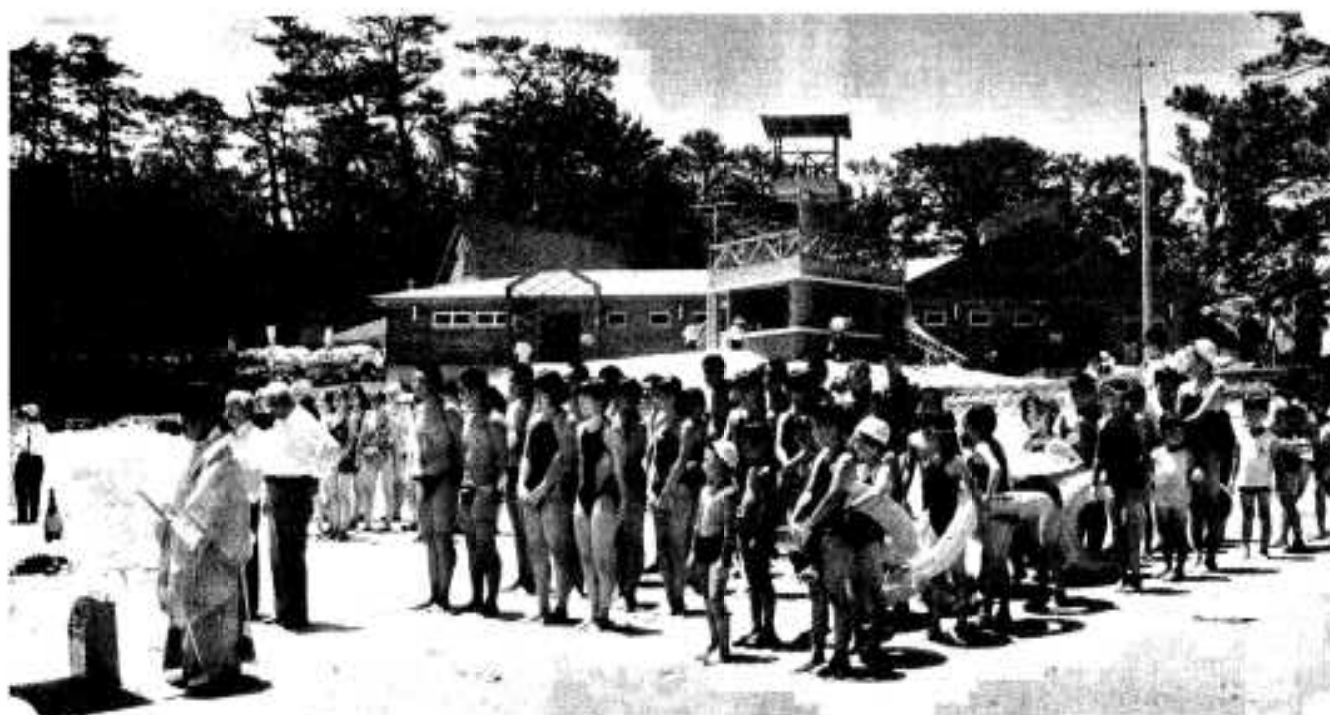
昨年、センターハウスが完成、施設整備が着々と進む阿久根大島。観光客の利用増にも期待が寄せられます。

この計画の事業実現のためにも、市民の皆様方のこれまで以上の深いご理解とご支援を頂き、市民一体となって豊かな活力ある阿久根市の創造と発展のために努力してまいります。最後になりましたが、皆様方のご健勝とご繁栄を心から折念申し上げ年頭のご挨拶いたします。