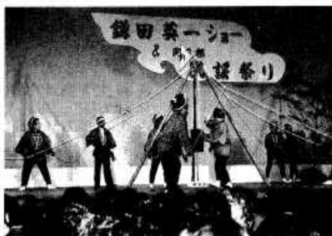
昔を思い出させた浜婦人会による「地つき唄」

故郷に古くから伝わる民謡や郷土芸能を愛し、伝えていこうと「阿久根民謡まつり」が十一月二十八日、市民会館大ホールであり、千五百人を越える民謡ファンが詰めかけました。