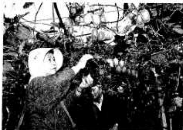
栽培棚からいねいに収穫