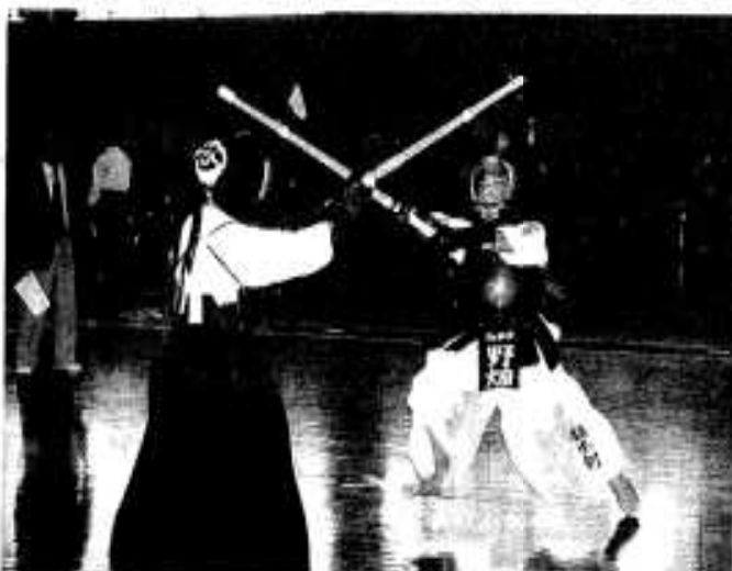
「メイン!!」— 元気な声が響きわたりました

市内からの出場チームでは脇本剣道スポーツ少年団が、小学生の部で見事優勝を果たしました。結果は次のとおりです。