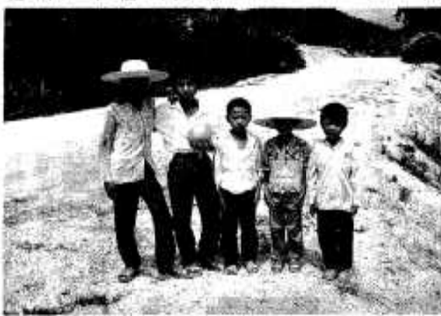
沙建村の子どもたち

重さ二百位、皮の厚さ二センチ、袋の数は十四、十六位。倒卵形で原産地はここ沙建村と同じ華安間の坪山で、坪山柚という品種でした。中国では有名品種で六百年の歴史があり、龍海・長泰・南靖でも栽培されて収穫