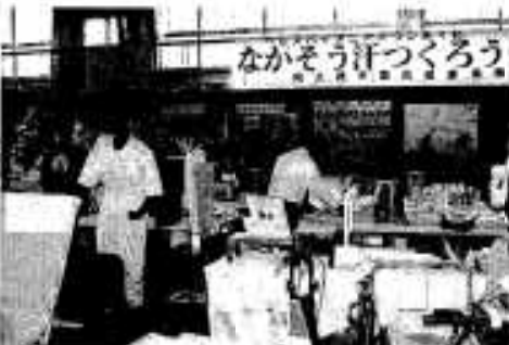
様々な介護機器も展示されました