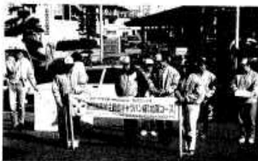
献血推進を訴えたキャラバン隊

本市は、北薩コースの最初の巡回地となり、市役所前でのセミナーでは、知事からのメッセージが読み上げられ、献血推進に対する協力が呼びかけられました。