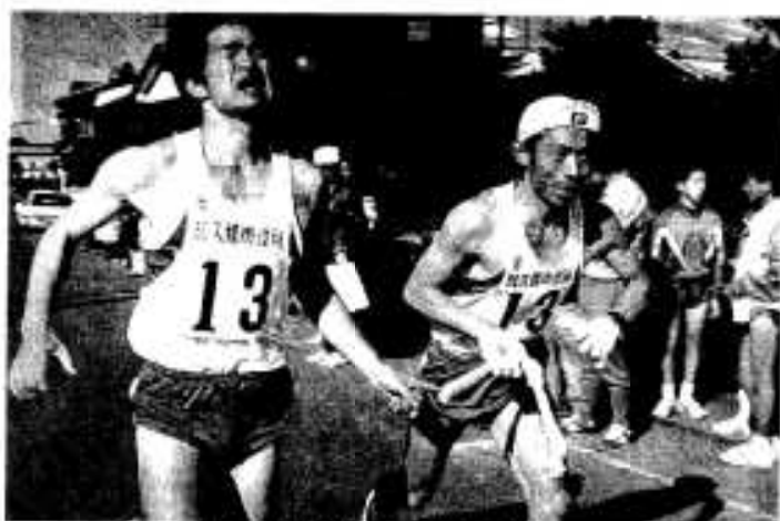
力を出しきり、次の走者へ

今年で四十二回目を迎えた伝統の市駅伝競走大会が十一月二十八日、総合運動公園陸上競技場を発着点に行われました。 秋晴れの絶好の駅伝日よりとなった当日は、男子が八区間二十七・五キロ、女子は五区間十一キロのコースで健脚が競われました。結果は次のとおりで、男子は阿久根農高と阿久根ゼンチクが力を見せつけ、昨年に続き優勝。女子は赤瀬川が二年ぶりに優勝に返り咲きました。