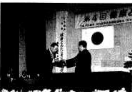
福祉向上に尽力された方々を表彰