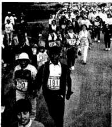
秋風に吹かれマイペースでウォーキング

「第4回阿久根市健康と福祉のつどい」が十一月十四日、市民会館と市民体育館で開かれました。