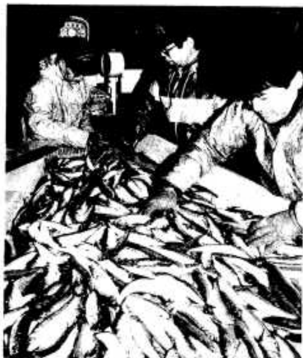
イワシの盛り人が躍る「ふるさと便」発送作業