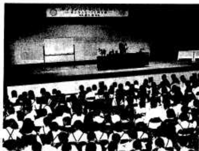
ボンタンの歴史について学びました

て開いたもので、ボンタンを通して本市の歴史とアジアとの関係について認識を深めてもらおうというものです。会場には市内の小学生が招待され、ボンタンのロマンあふれる歴史に思いを巡らせていました。