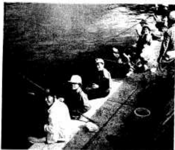
釣り糸を垂らし大きな当りを持つ児童ら