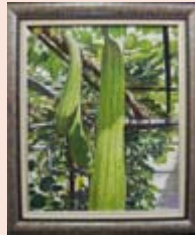
【阿久根市教育長賞】 『陽ざしを受けて』 鮫島 和子 (さつま町)