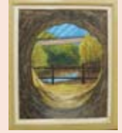
【功労賞】 『曾木ノ滝公園 No.2』 川崎 照男 (出水市)