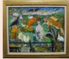
【阿久根市長賞】 『人と動物達のふれあい』 赤城 繁治 (出水市)