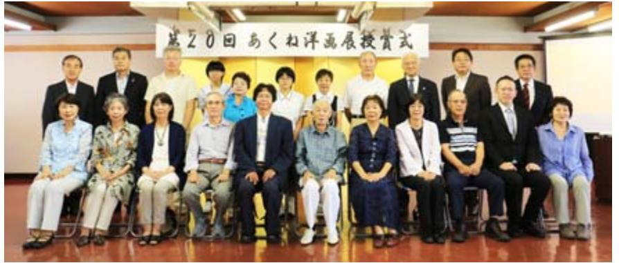
「一般・高校生の部」受賞者の皆さん

8月25日から9月2日までの間、会場には人物や風景、抽象画などの力作356点が展示され、来場者は思い思いに絵を鑑賞していました。