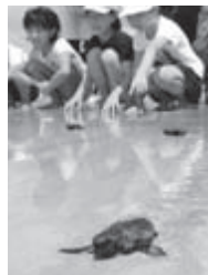
海に向かって懸命に歩くカメに「元気でね〜」と声をかけながら見送る子どもたち=脇本海岸

1964年の東京オリンピック開催のとき、阿久根市は、聖火リレーの中継所になり、県下唯一の聖火宿泊地となりました。開会式のちょうど1月前にあたる9月6日に聖火が到着すると、阿久根市は、感激と緊張に包まれ、全市を挙げて歓迎を行いました。聖火台は、県下唯一の聖火宿泊地を記念して建立されました。