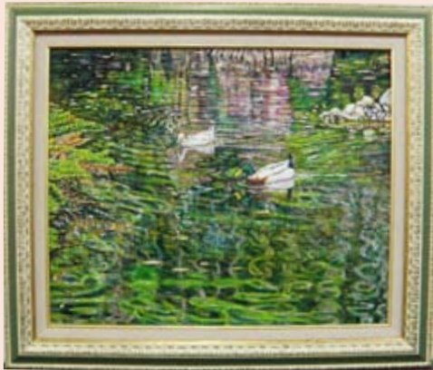
【あくね洋画展第 20 回記念大賞】 『静寂 I』赤松 繁 (出水市)