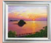
『夕焼けに魅せられて』 中山 勝久 (阿久根市)