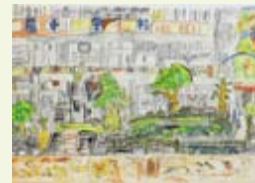
【県美術協会長賞】 『平尾小学校』 吉武 海翔 (平尾小 5 年)