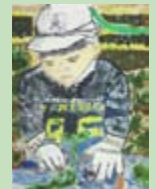
『大きいもになあれ』 リー謙二 (田代小 3 年)