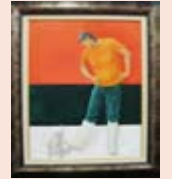
【新人賞】 『トリコロール・ふむき?』 若松 伸一 (阿久根市)