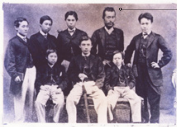
薩摩藩英国留学生写真 尚古集成館所蔵