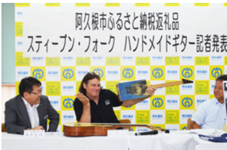
記者発表会で「トロ箱」を加工して作ったギターを披露するスティーブンさん（中央）＝7月23日、阿久根市役所