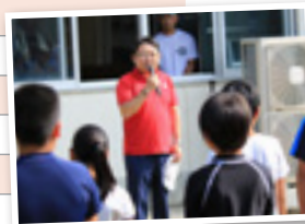
7月16日、海の子カーニバルで子どもたちを励ます西平市長