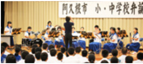
(上) 真剣に弁士の話に耳を傾ける来場者。 (中) 内容や話し方をチェックする審査員。 (下) アトラクションとして、三笠中吹奏楽部による演奏が披露されました。

きっかけは、インフルエンザです。今、心配して一生懸命熱を下げようと世話をしてくれる母。私は、寝ているだけでよかったです。でも、私がふるさとを離れ、一人暮らしをしていたら、体調を崩しても、家には私ただ一人です。誰もそばにいません。誰もご飯を作りません。私が倒れても、きつとすぐには見つけられないのでしょうか。高熱でふらふらしながら、水分も食べ物も、自分で管理をしなければ、いつ脱水症状で死んでしまってもおかしくな