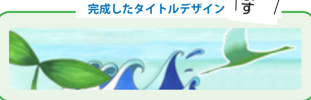
完成したタイトルデザイン

鶴 翔NEWSが第41号を迎えることに当たり、タイトルイラストを鶴翔高校美術部が制作したものに変更しました。