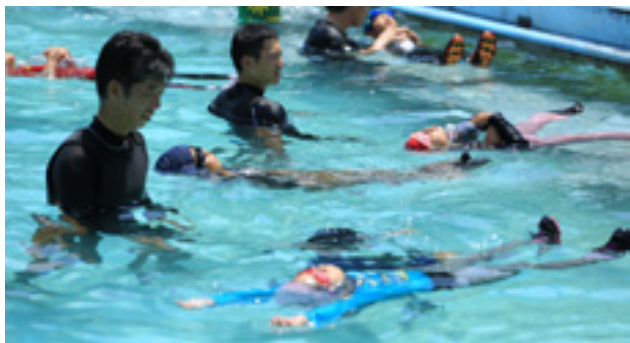
服を着たまま水に浮く練習をする子どもたち ＝折多小学校