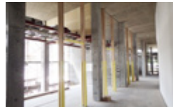
◀ 建具工事中の楽屋

緑の山々から届く風の通り道である大きな屋根を持ったテラスのような施設という意味です。人々が集い、交流するテラスのような憩いの場所になるようにという願いを込めて、この愛称を考えました。