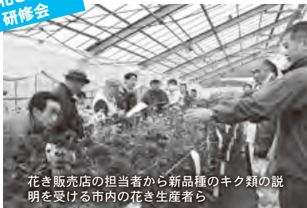
花き販売店の担当者から新品種の花き類の説明を受ける市内の花き生産者ら