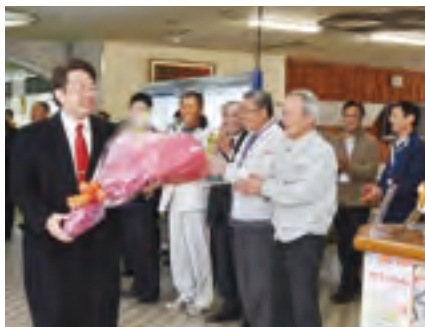
当選後の12月22日、初登庁される西平良将市長