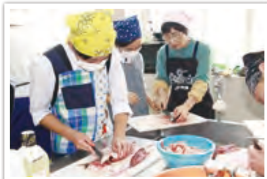
毎年、北さつま漁協女性部の皆さんの協力により行っている魚の料理教室

学校では、少人数の良さを生かした学習や思い出に残る体験活動など、地域と一体となって子どもたち一人ひとりの人間的成長を育んでいます。