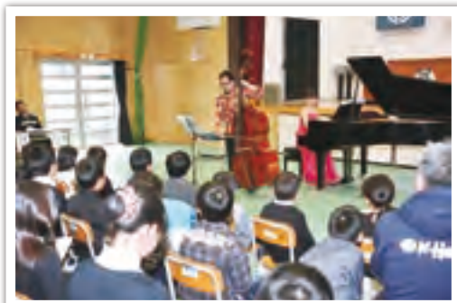
11月16日に開催された「でんえんコンサート」は、15回目を迎えました

特に、地域の教育素材を活用したあくまき作りや親子による田植えや稲刈り、餅つき会、高齢者とのふれあい活動、でんえんコンサートなど様々なふるさと体験活動を通して、心豊かな人間性を培っています。