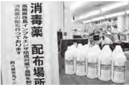
▲市役所 農政課の窓口

万一、触れてしまった場合は、うがい・手洗いを行うとともに、発熱などの健康状態に異常が出た場合は、速やかに医療機関で受診し、死亡した野鳥などと接触したことを医師に伝えてください。