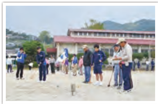
11月12日、大川中で行われたシルバーフレンド活動。地域の高齢者の方々とグラウンドゴルフ等で交流を深めました

大川中学校 阿久根市大川8250番地 ☎0996(74)0004 大川の自然豊かな中、落ち着いて学習に打ち込める環境が整っています。 『人前力』発揮!」をキャッチフレーズに、小規模校の良さを生かして知・徳・体にわたり、一人ひとりを大切にしたい教育活動に取り組んでいます。 あたたかい保護者の皆さまや地域の方々と、子どもたちの育成にがんばっています。 (大川駅より徒歩3分)