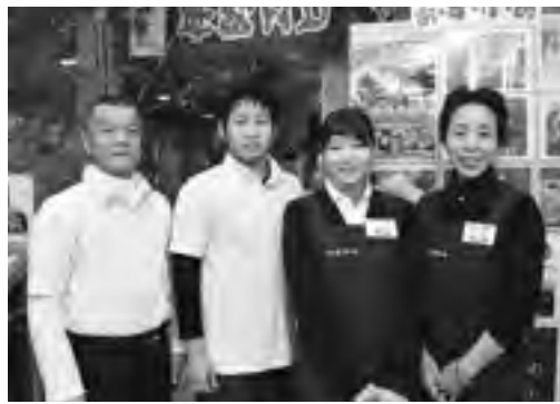
道の駅「阿久根」のスタッフ