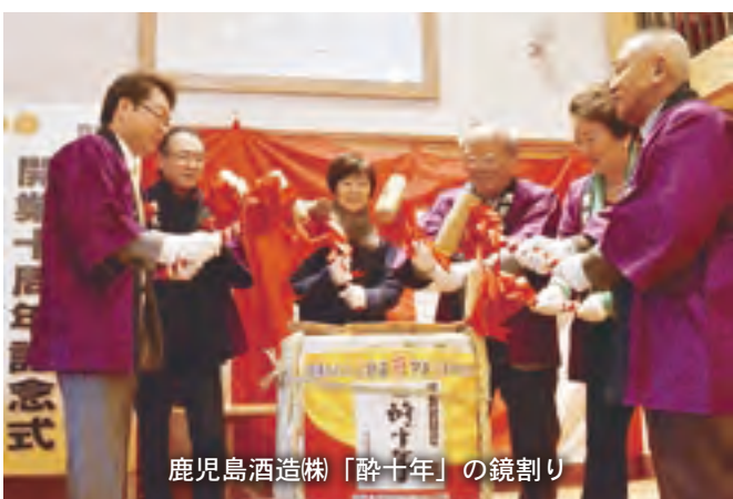
鹿児島酒造株「酔十年」の鏡割り

式では、阿久根中学校OBによる力強い「エッサッサ」が披露されたほか、観光列車「おれんじ食堂」の駅到着に合わせて、鹿児島酒造株が10年前に仕込んだ焼酎「酔十年」の鏡割りが行われ、乗客や駅利用者などに振る舞われました。