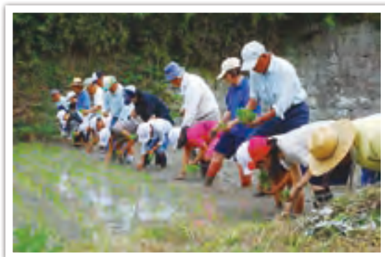
地域の方々や保護者の協力により行っている学校田の田植え