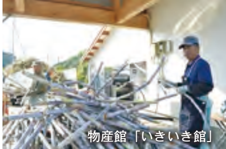
物産館「いきいき館」