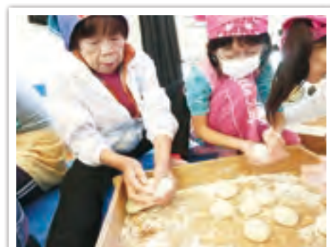
12月9日、田代小の学校応援隊の協力により行った「もちつき大会」