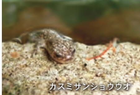
カスミサンショウウオ