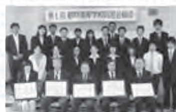
記念して旧3校の校旗を額装し、新たな伝統の幕開けとなりました。

【記事】 旧3校の校旗を 【投記】 鶴翔高校で保管 11月1日、鶴翔高校の第1回同窓会総会が開催され、これまでの功績を称えて旧3校(長島、阿久根、阿久根農業、鶴翔高校初代同窓会・会長の表彰式が行われました。また、これを