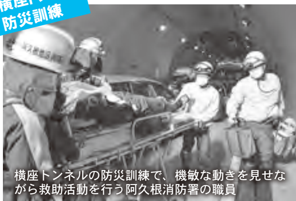
横座トンネルの防災訓練で、機敏な動きを見せながら救助活動を行う阿久根消防署の職員