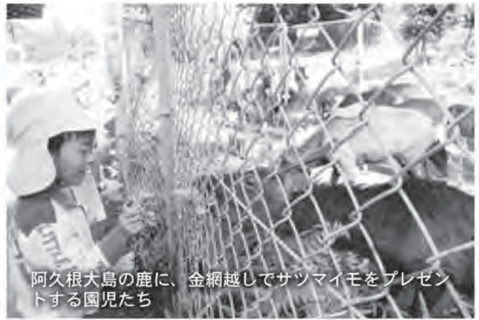
阿久根大島の鹿に、金網越しでサツマイモをプレゼントする園児たち