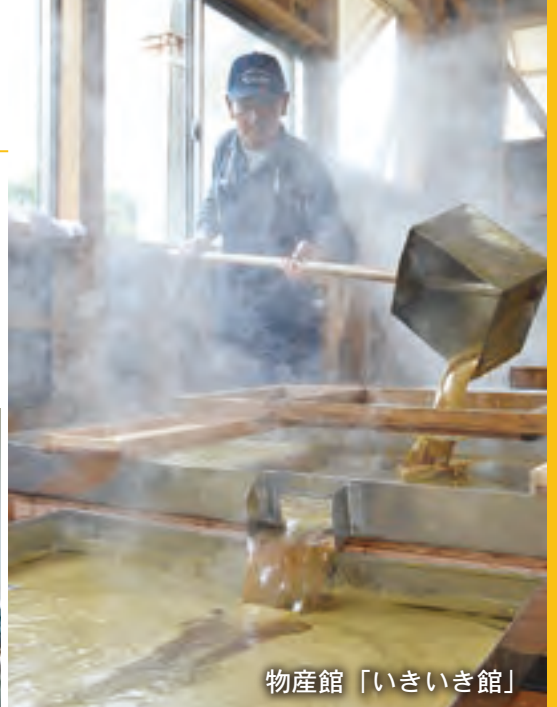
物産館「いきいき館」