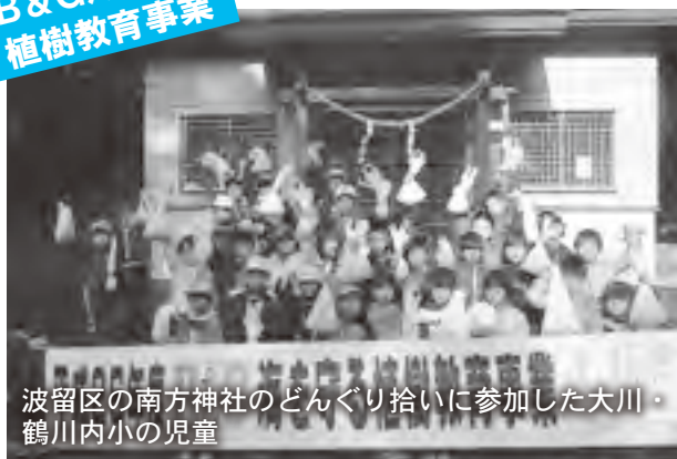
波留区の南方神社のどんぐり拾いに参加した大川・鶴川内小の児童