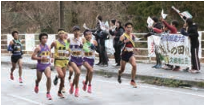
横断幕と旗で選手を応援する田代小の児童

大会 3 日目となる 17 日は、出水市野田から霧島市までの 11 区間 122.6km。第 1 区は野田支所から山村開発センターまでで、田代小学校近くでは、児童が自作の横断幕や旗を掲げて応援し、駆け抜ける選手たちの背中を後押ししていました。