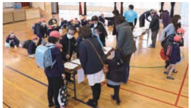
屋内退避準備指示を受け、保護者へ児童を引き渡す訓練

「県西部直下地震（最大震度7）が発生し、川内原子力発電所において、原子炉の自動停止・電源喪失などが発生した」という想定で訓練を実施し、児童・職員は、学校で定めた危機管理マニュアルなどに基づいた避難手順を確認・実行。原子力防災に対する対応の習熟や防災意識を高め、市災害対策本部や保護者との連携確認・強化も図りました。