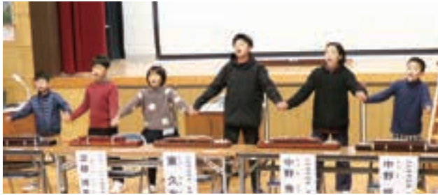
全校児童6人が歌と大正琴の合奏でおもてなし♪