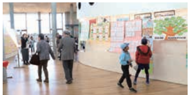
ホールでは多読賞受賞者おすすめ本とコメントの紹介や市内小中学校読書活動展覧会、市立図書館活動内容パネルの展示がありました。