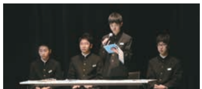
大川中学校の 3 年生による寺島宗則についての研究発表もありました。