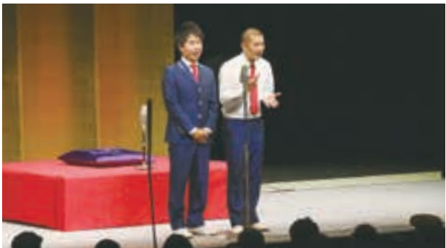
11月10日開催 「NHKラジオ第1・国際放送「真打ち競演」公開収録」