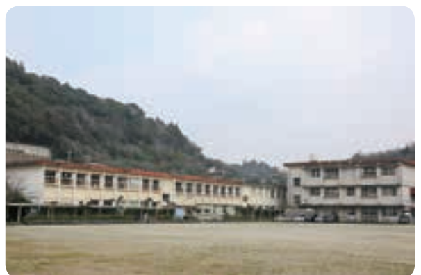
本年度末で閉校する大川中学校

このような状況を踏まえ、教育委員会では、学校の適正規模について現在協議しているところです。