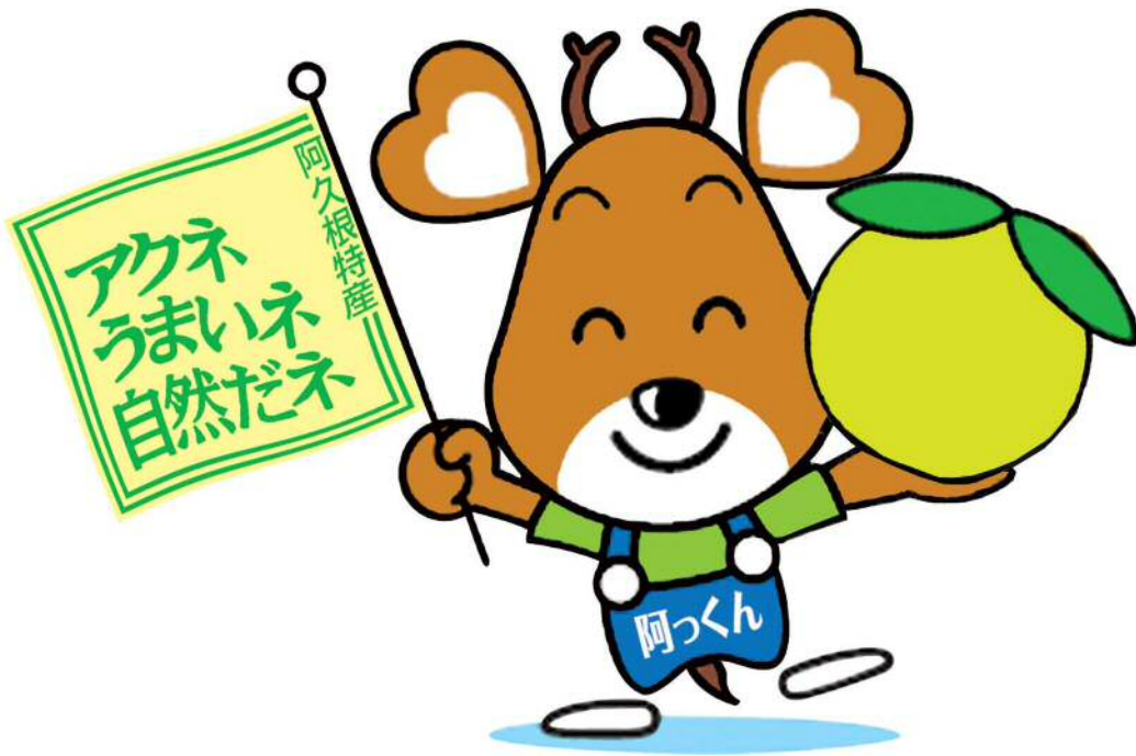
阿久根市 阿っくん

このしおりには、入所申込に関する事項だけでなく、保育所等入所期間中に係る事項等が記載されておりますので、大切に保管してください。