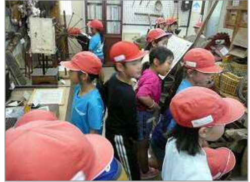
24日 西目小学校見学