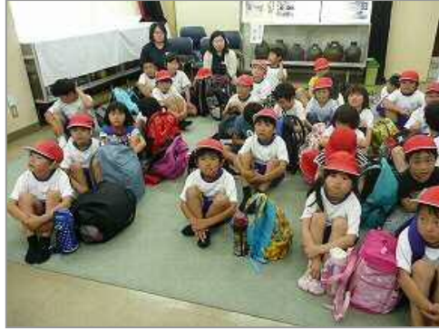
17日 折多小学校見学