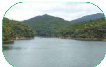
清らかな水を育む