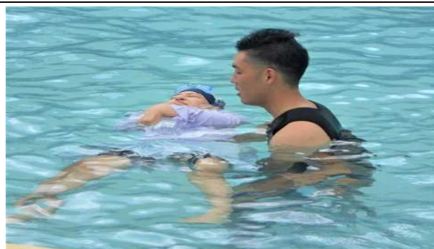
【7月7日：全児童 着衣水泳】 阿久根消防署員の方に、もしもの時のために、体を浮かせて救助を待つ方法を教わりました。