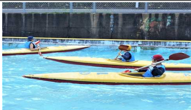
【7月8日：全児童 カヌー体験活動】 高松川の水量が多かったため、プールで実施。パドルさばきが難しく思うように進みません。