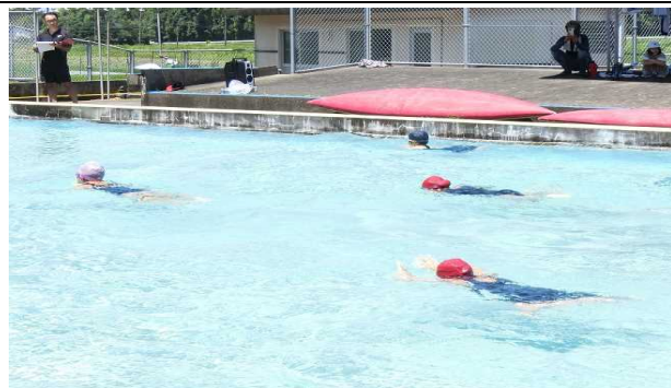
【7月11日：全児童 校内水泳大会】 自分の目標達成に向け、これまでの水泳学習の成果を発揮しました。リレーは大接戦でした。