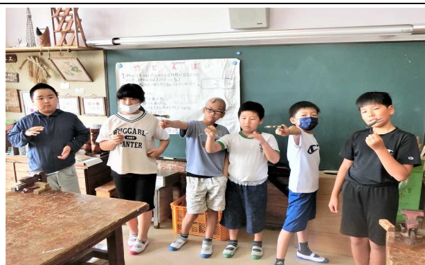
【6月21～22日：5・6年 集団宿泊学習】 川内少年自然の家で、協力してしっかり活動しました。自作の竹とんぼを手に、決めポーズ。