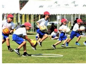
出し入れどっち? (下学年)