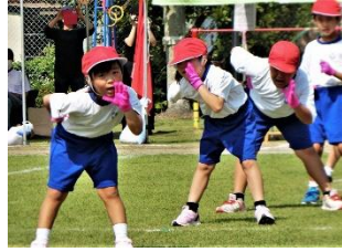
表現～キャラクター (下学年)