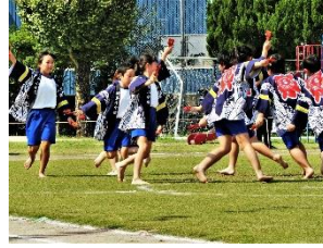
折多ソーラン2022 (上学年)