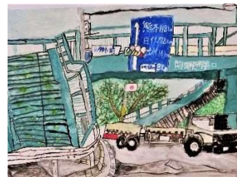
6年筒さん「みんなが使う歩道橋」