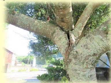
【正門近くの桜の木】