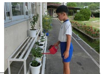
「きれいなお花咲かせてね」 水かけにいそむ2年生

そんな中でしたが、10日（水）の朝、みんなに愛されていたうさぎのおもちが突然亡くなりました。とても悲しい死でしたが、飼育委員会の子どもの中心にお墓を作り、昼休みにたくさん子どもたちが集まり、自分たちで探してきた花を手向けて、おもちとお別れの会をしました。おもちは、子どもたちや我々大人に改めて命の大切さ、生き物の死を教え、そしてこれまで優しい心も育ててくれました。今回の経験を糧に自他の生命の尊さを実感し、自然を大事にしていこうとする気持ちをより一層育ててほしいと願っています。