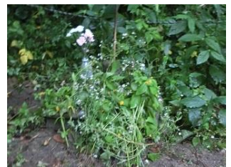
お墓に供えられたたくさんのお花

さて、いよいよ子どもたちが楽しみにしている夏休みが近づいてきました。先日、高知市の小学4年生が中学校プールでの水泳授業中に溺死するなど、夏休み前から全国各地で小中学生が犠牲になる悲しい水の事故が多発しています。繰り返しになりますが、なんといっても一番大切なものは「命」です。「自分の命を自分で守る」ことを常に心がけ、安心・安全な充実した夏休みを過ごしてほしいものです。人や本との出会い、自然やものとのふれ合い、地域の行事や旅行先での実体験など、普段とは違う非日常の中で、人間的成長の「きっかけ」となる様々な出会いが子どもたちに訪れることを期待しています。