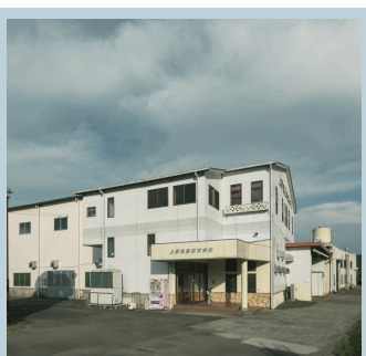
上野食品株式会社

創業：1963（昭和38）年 事業内容：食料品製造 従業員数：18人 勤務時間：8：00～17：00 休日など：会社カレンダーによる 所在地：山下7607番地 電話：73-1500