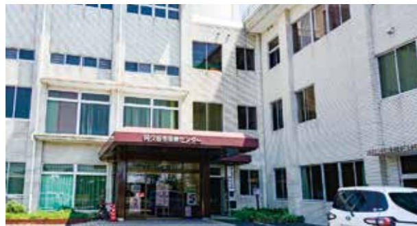
④ 阿久根市保健センター