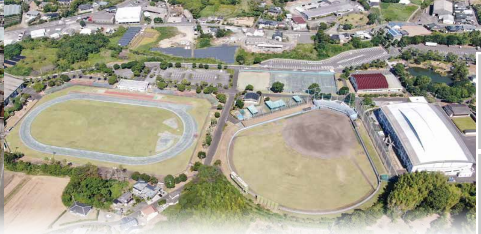
⑥ 阿久根総合運動公園