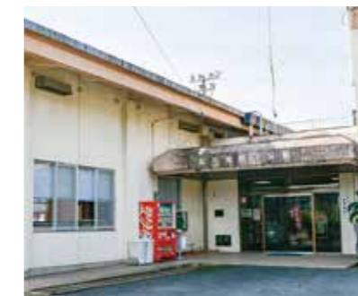
⑧ 三笠支所・脇本地区公民館