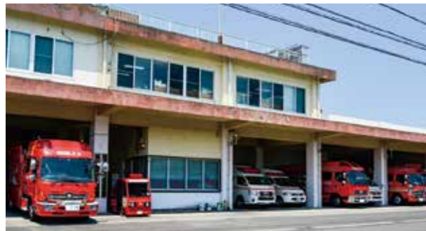
② 阿久根地区消防組合（阿久根消防署）