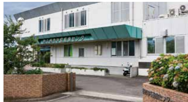
⑤ 学校給食センター