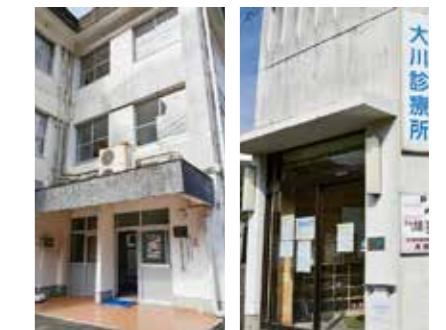
⑨ 大川出張所・大川診療所