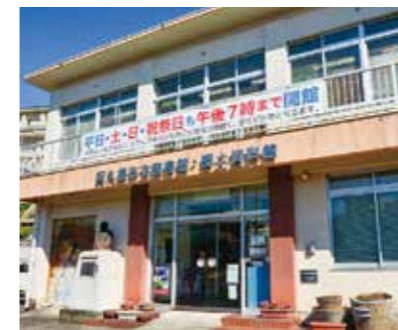
⑦ 市立図書館・郷土資料館