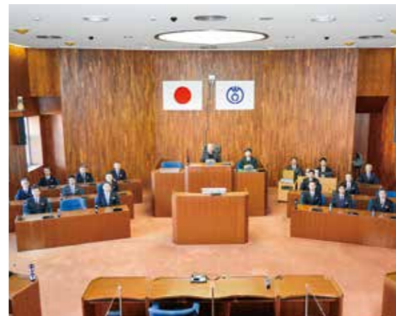
議会風景 (傍聴席から)