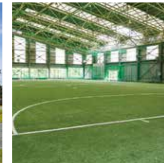
多目的雨天屋内運動場