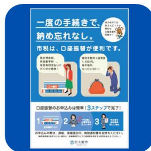
(税務課) 口座振替勧奨チラシ