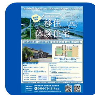
(企画推進課) 移住定住促進