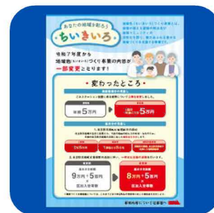
(企画推進課) 区長向け事業周知チラシ