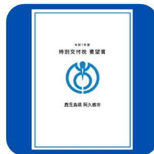
(財政課) 国への要望書