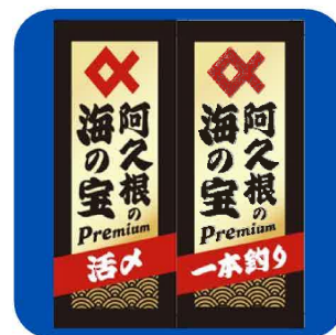
(環境水産課) 鮮魚ブランドタグ