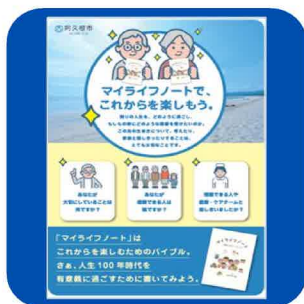
(介護長寿課) ACP啓発チラシ