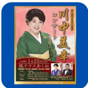
(生涯学習課) イベント告知チラシ