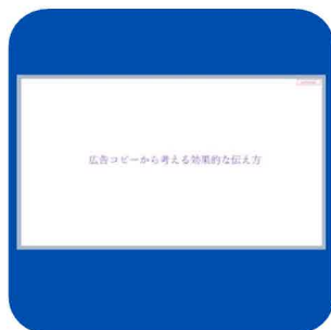
(総務課) 職員向け研修

“分かりやすい” “伝わりやすい” 情報発信に向け、 研修の実施、チラシ等のクオリティUPに取り組みました。