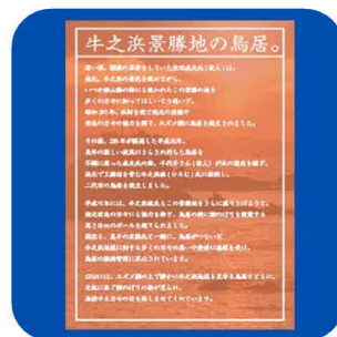
(商工観光課) おもてなしポストカード