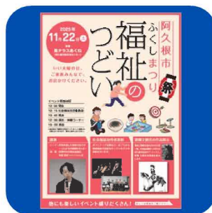
(福祉課) イベント告知チラシ