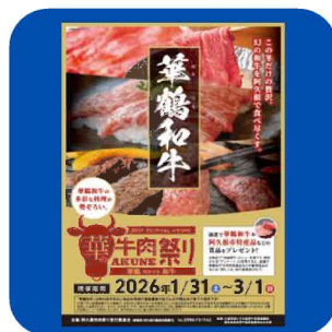
(農政林務課) イベント告知チラシ