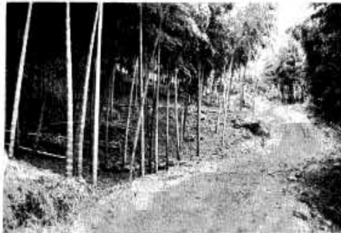
すすむ竹林改良（弓木野）

市の自然条件は、タケノコ生産に適しており、十一月から出荷を始めています。現在、週三回農協を通じて出荷され、東京市場や阪神市場で高値で販売されています。