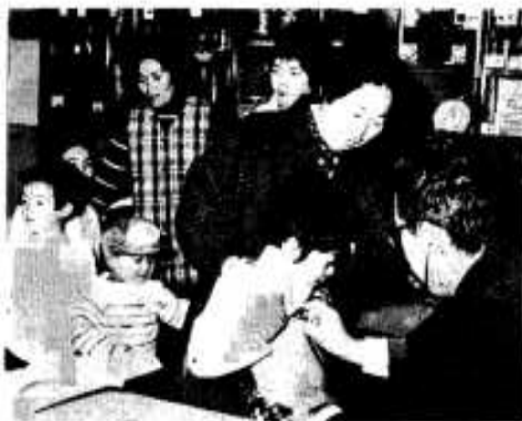
就学予定者の健康診断(華人小)

市では、昭和五十一年度の就学予定者四百四十五人を対象に、一月二十一日から二月六日まで、華人小学校など市内十会場で、聴力・視力・歯・栄養・背柱などの健康診断を行いました。