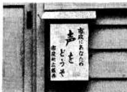
公聴箱もご利用を

市では、これらの問題を十分考慮しながら、これからの市政に反映させていく考えです。 市民のみなさんの中で、市政に対する建設的な意見をお持ちのかたは、お近くの市政モニターのかたか、市役所総務課秘書広報係までお知らせください。 また、市役所・支所・出張所には、市民のみなさんの声をお聞きするために、公聴箱を備えてあります。市政や市役所のこと、お気付きのことなど気軽にご利用ください。