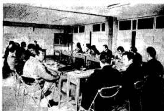
活発な意見がでたモニター会議

把握や市政に対する相談照会など市政全般に対する提言をしていただくことになっています。これは主権者である市民のみなさんの意志を、市政に反映させていくためであり、今後にも市政モニター制度などを通じて、幅広い公聴活動を続けていくこととなります。