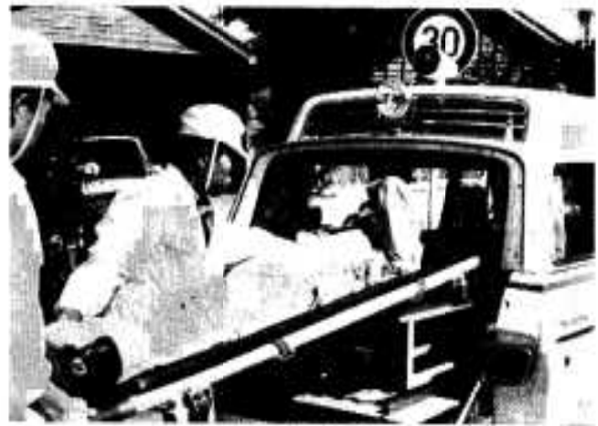
万一事故のときは救急車で

昭和五十年の阿久根消防署の救急車出動件数は、別表のとおり四百十四件で、四百三十一人が医療機関に搬送されています。 このことは、一日平均一・一四件、二十時間に一件の割合で救急車が出動したことを示し、市民七十一人に一人が救急車を利用されたこととなります。 救急業務は、消防業務のひとつとして消防署が行っています。市民のみなさんの生命と健康を守るために、災害などによる事故防止の対策はもとより、救急体制の充実強化に努力しています。 市民のみなさんが、いつ、どこで事故にあっても、適切な救急サービスが受けられるよう、救急体制の強化を図らなければなりません。