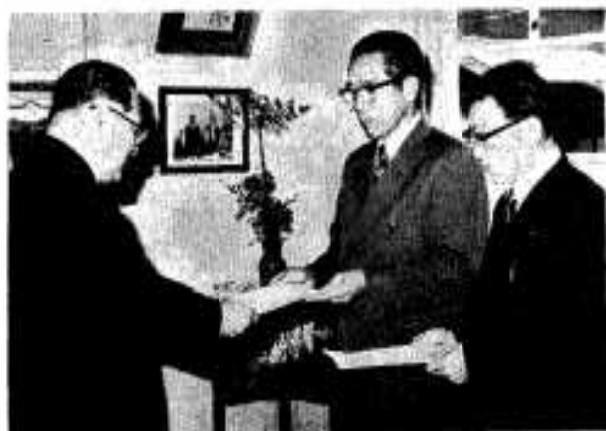
市長一目録を贈呈する富吉・馬場の両氏